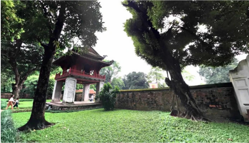
Khue van cac che do xem pho va 360deg