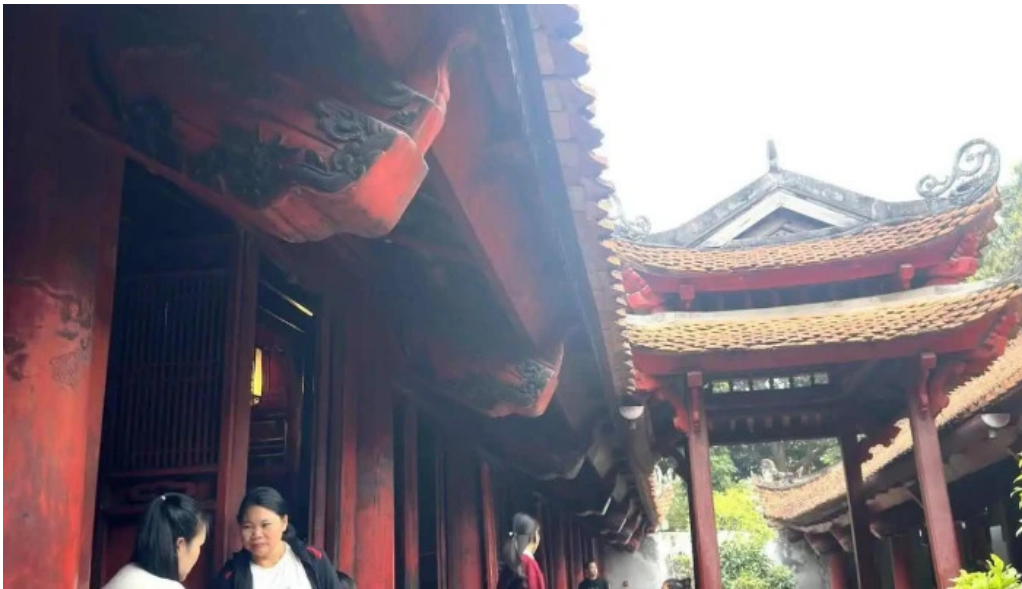
Khue van cac moi nhat