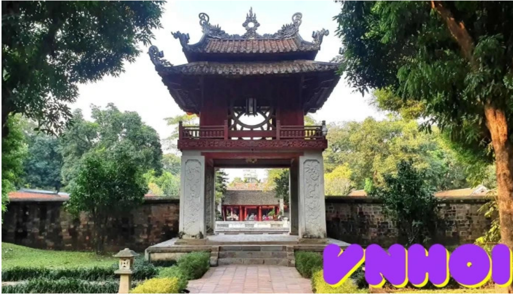
Khue van cac tat ca