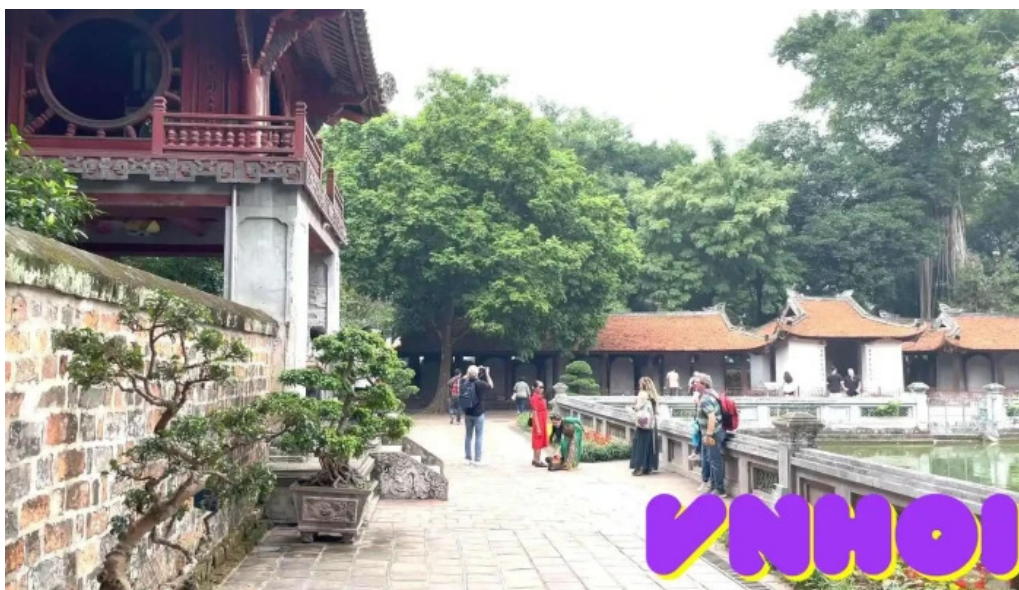
Khue van cac video