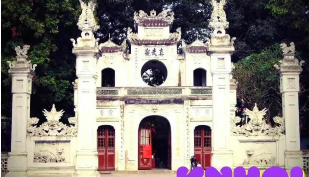
Den quan thanh tat ca