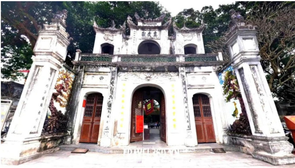
Den quan thanh che do xem pho va 360deg