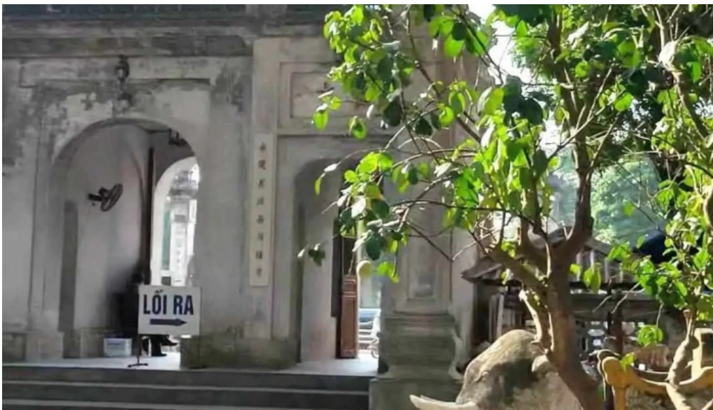
Den quan thanh video