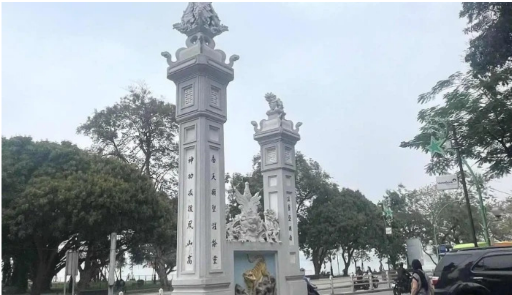
Den quan thanh moi nhat