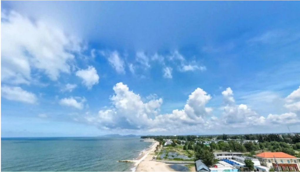
Du lịch hồ trầm che do xem pho va 360deg