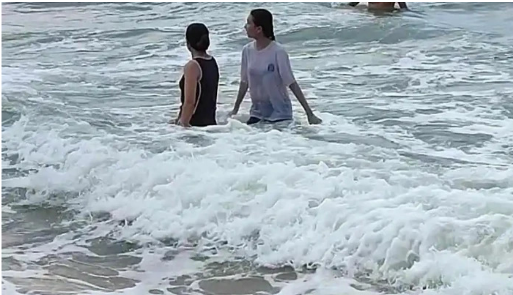
Du lich ho tram video