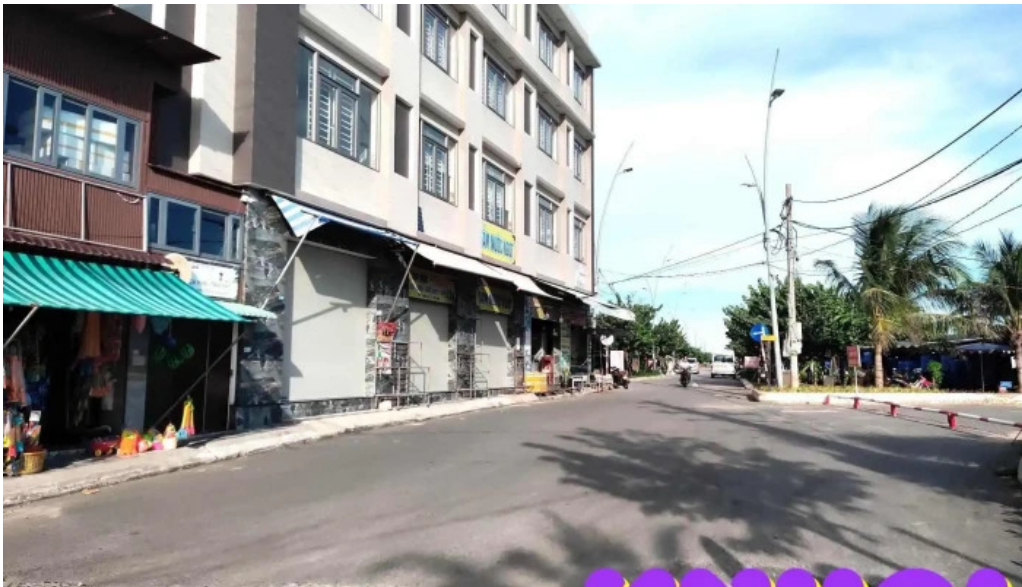
Du lich ho tram ngoai that