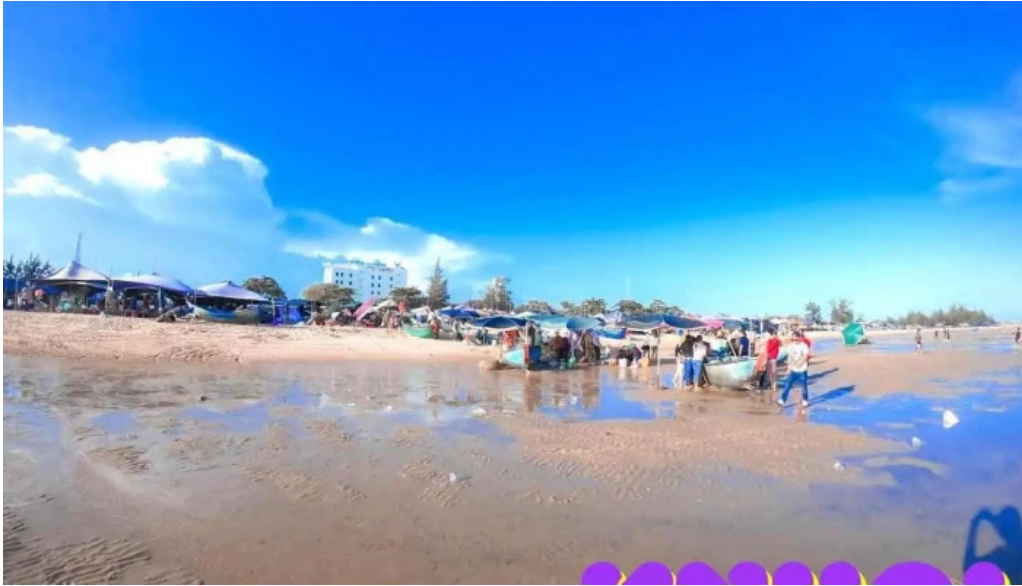
Du l?ch h? tram ba r?a v?ng tau