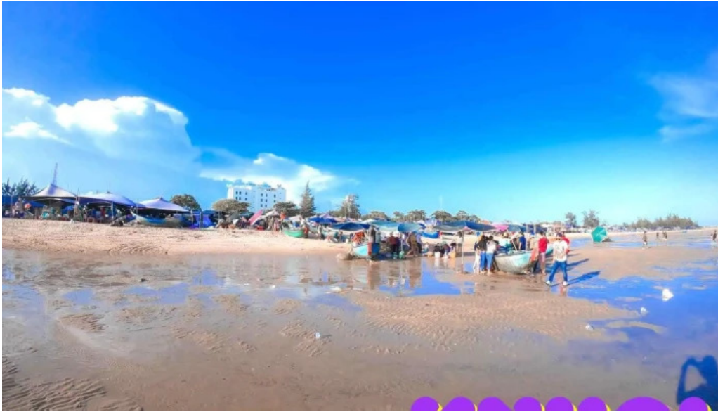
Du lich ho tram tat ca