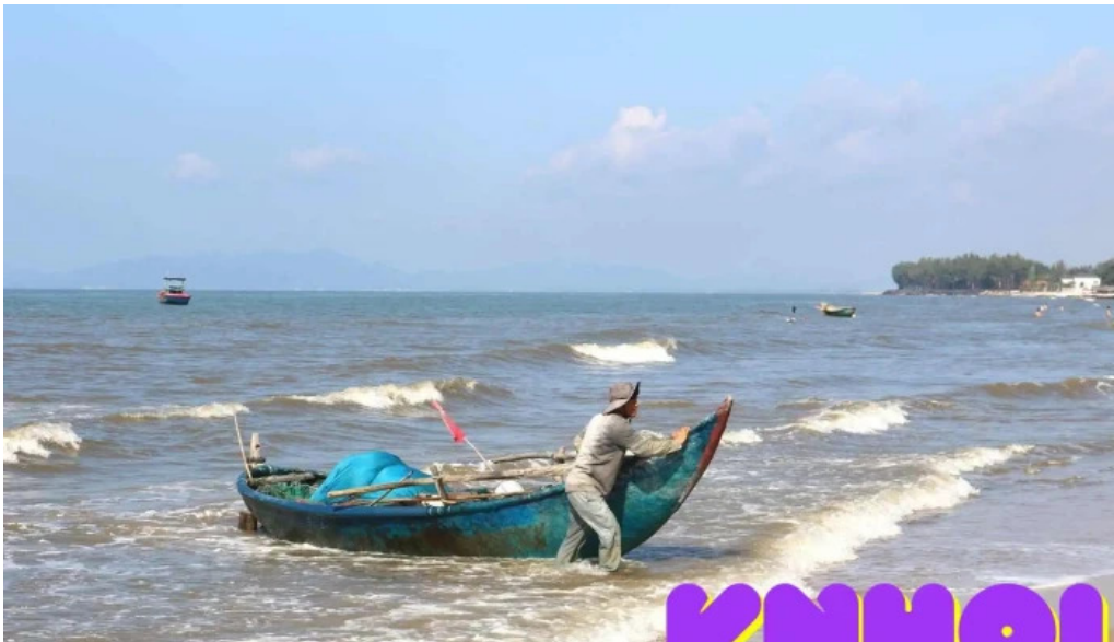
Du lịch ho tram của chủ sở hữu