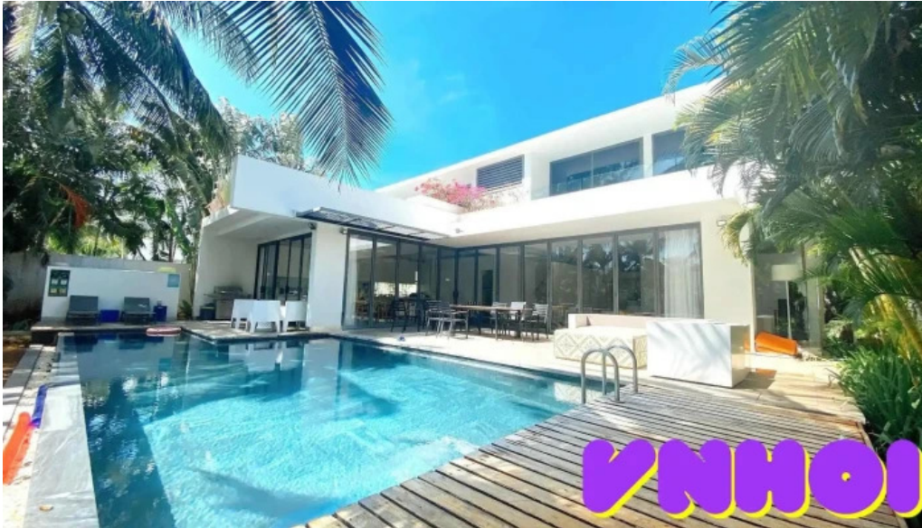
Du lịch ho tram khong gian ben trong