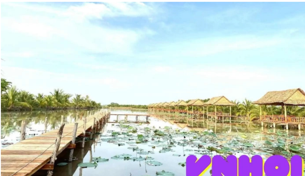
Du lịch sinh thái tiên sen vùng tháp vùng tháp