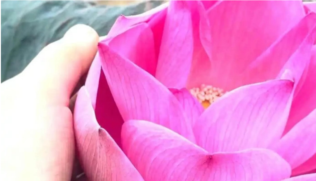
Du lịch sinh thái tiên sen đồng tháp mới nhất