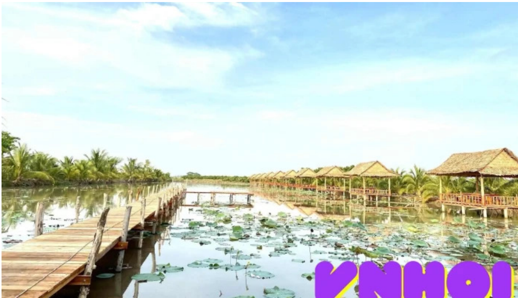
Du lịch sinh thái tiên sen đông thạp tất cả