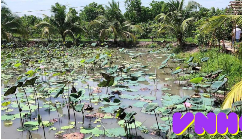
Du lịch sinh thái tiên sen đông thạp video