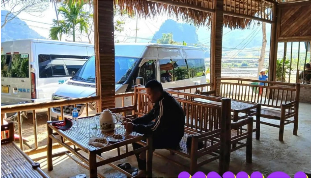
Be tre suoi cham khong gian ben trong