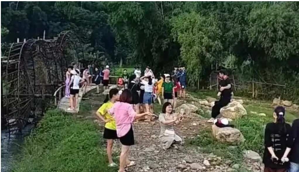
Be tre suoi cham cua chu so huu