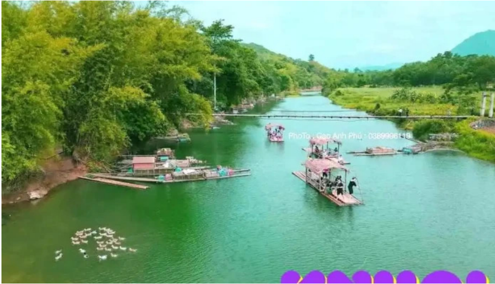
Be tre suoi cham tat ca