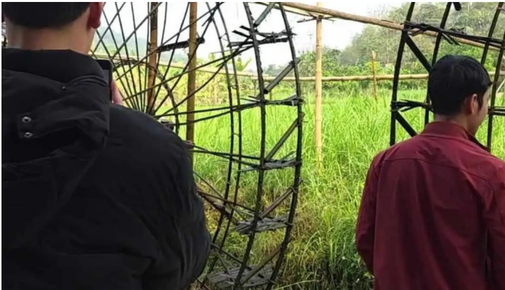
Be tre suoi cham moi nhat