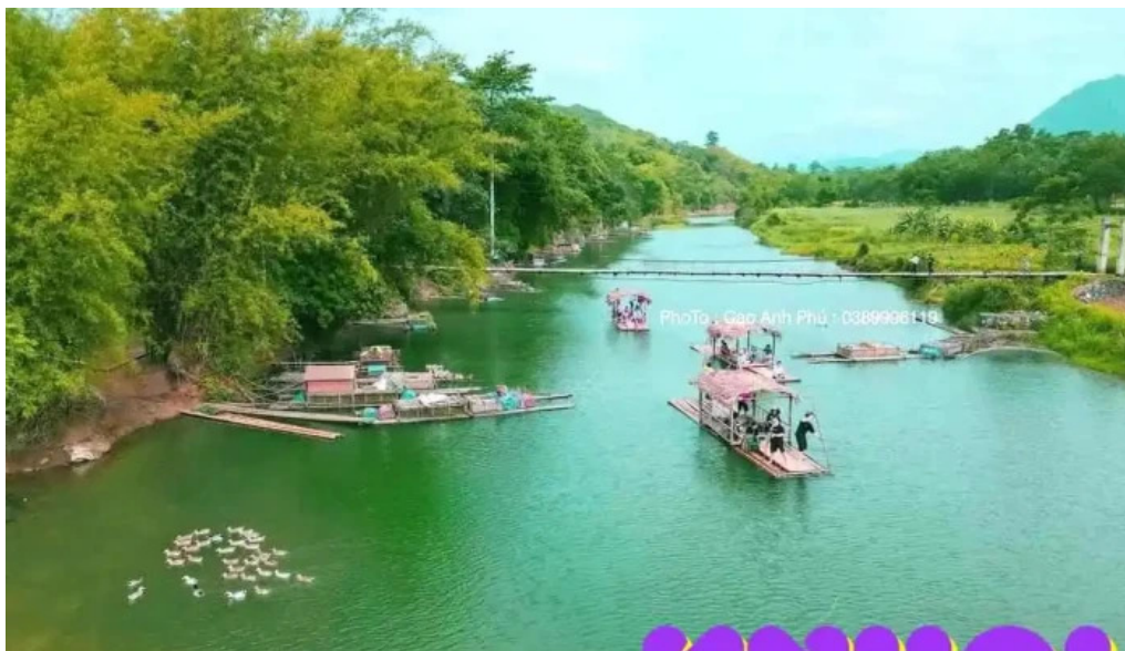
Be tre su?i cham thanh hoa