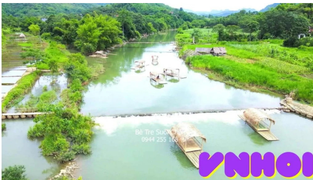
Be tre suoi cham video