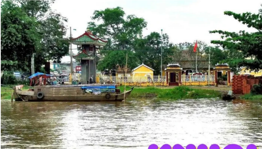
Dinh binh thuy tat ca