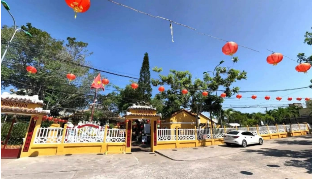
Dinh binh thuy che do xem pho va 360deg