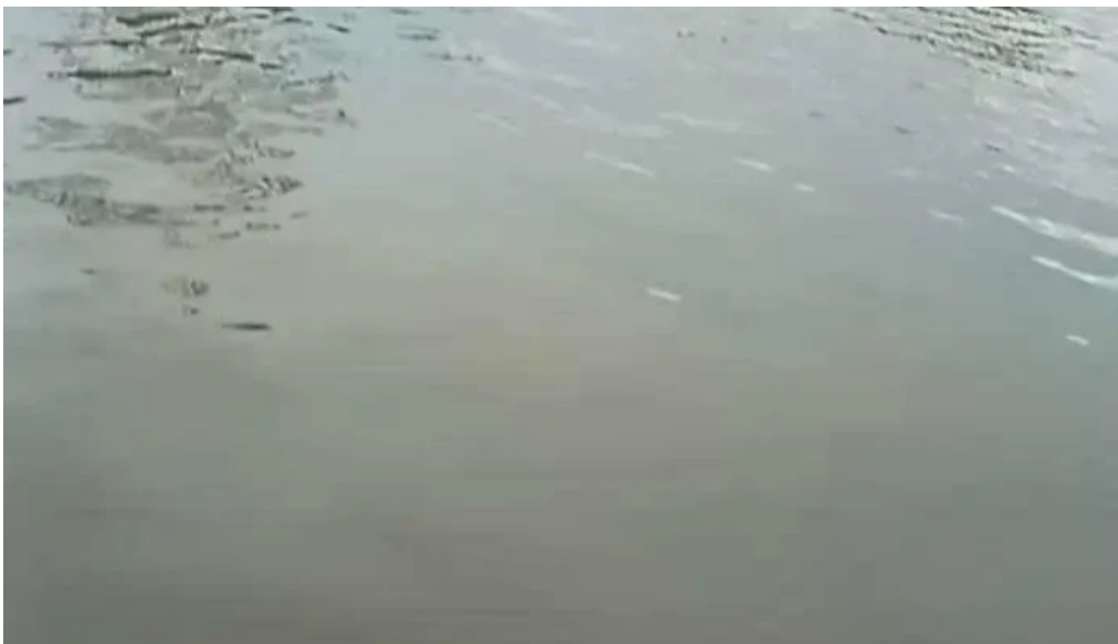
Dinh binh thuy video