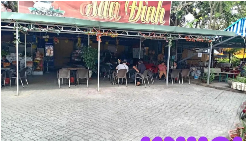
Dinh binh thuy moi nhat