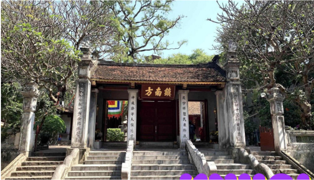
Den dinh kim lien tat ca