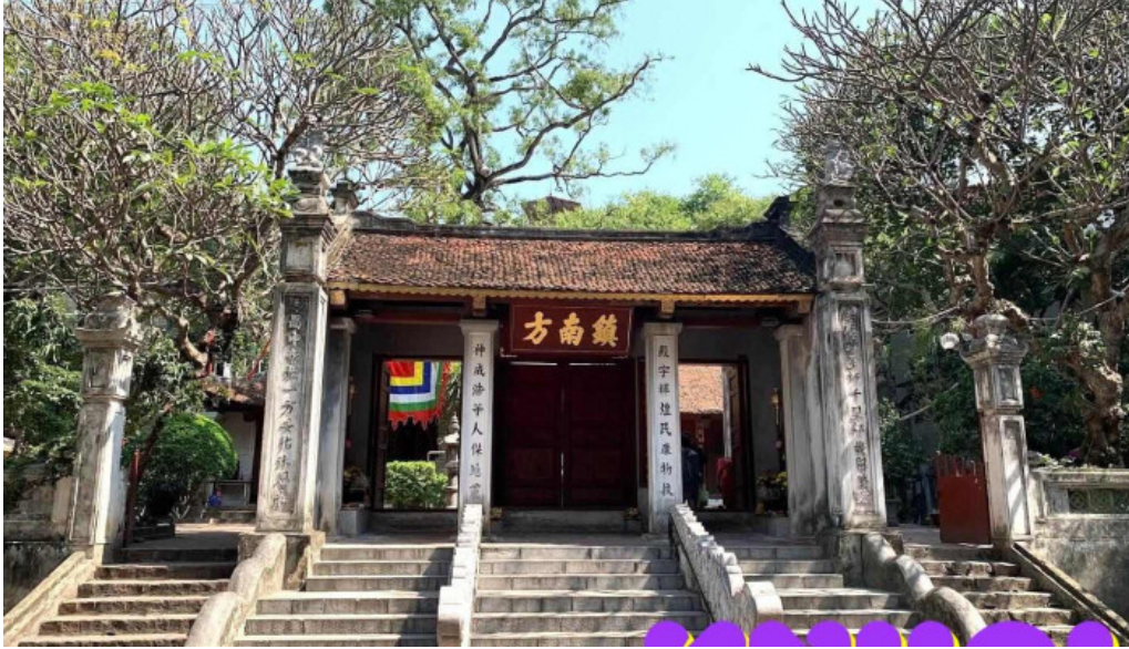
??n ?inh kim lien ha n?i