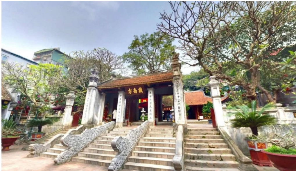
Den dinh kim lien che do xem pho va 360deg