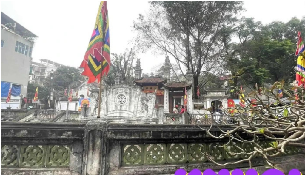
Den dinh kim lien moi nhat