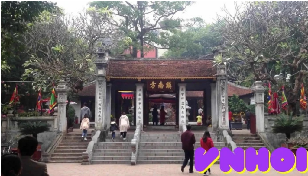
Den dinh kim lien video