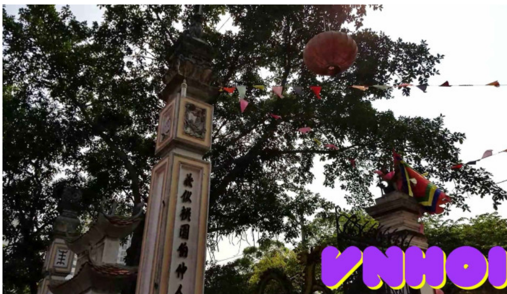
Dinh tuong mai video