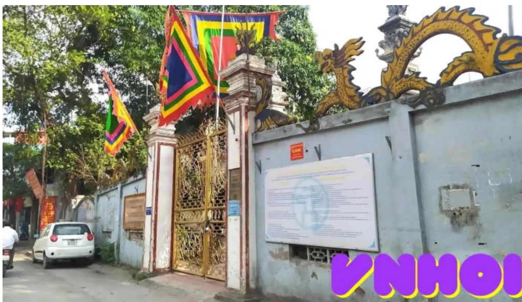
Ảnh t?ng mai ha n?i