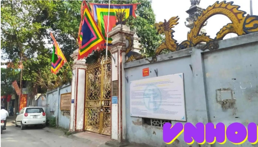
Dinh tuong mai tat ca