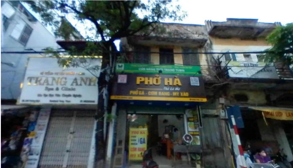
Dinh tuong mai che do xem pho va 360deg