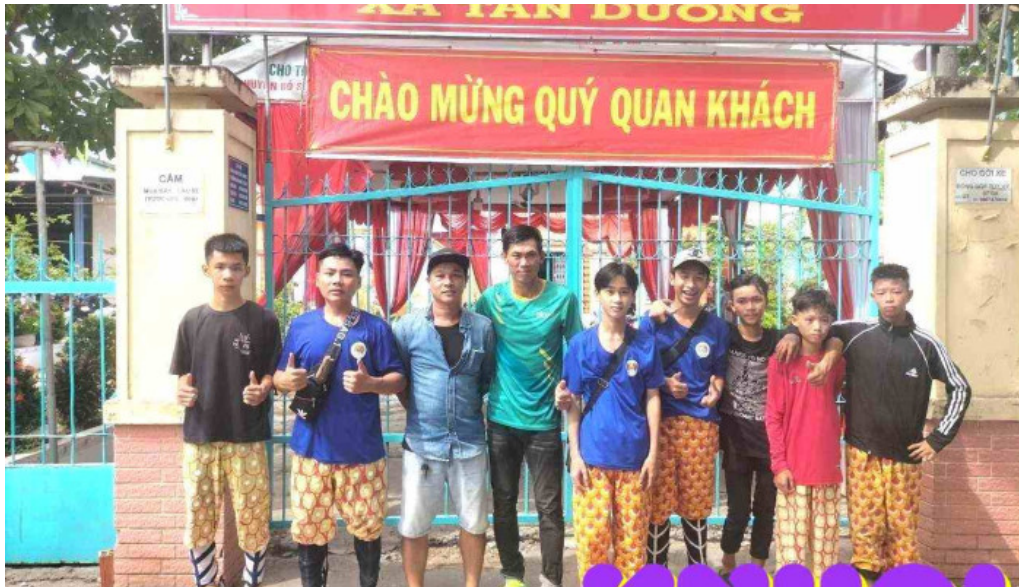
Dinh than tan duong tat ca