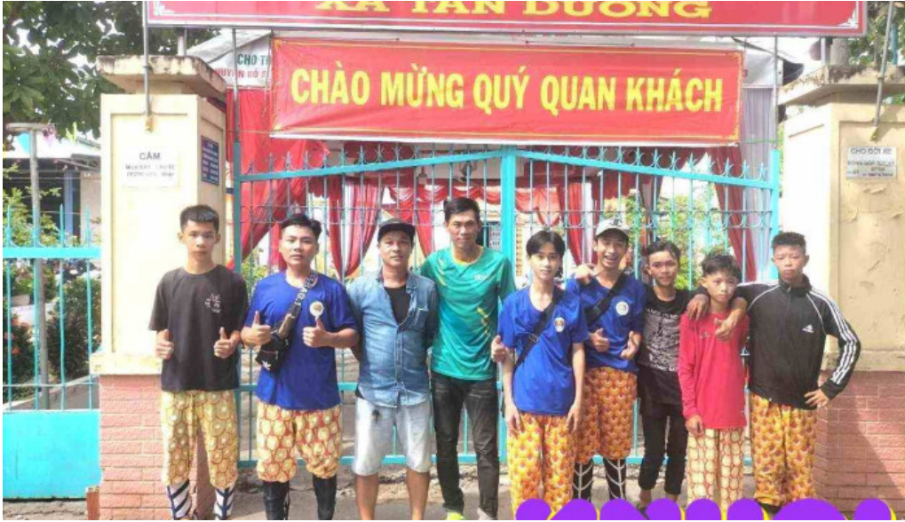
Ảnh thôn tan đòng đòng thập