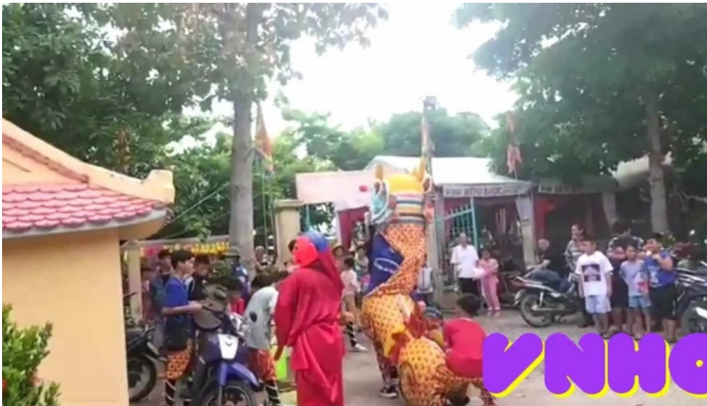
Dinh than tan duong video