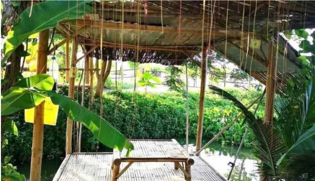
Dat con david dt của chu so huu