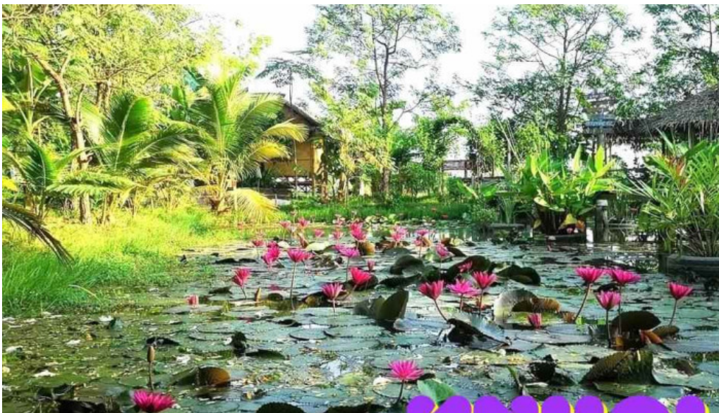
Dat con david dt tat ca