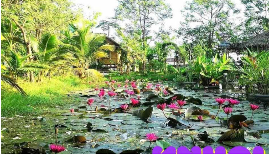
??t c?n david ?t ??ng thap