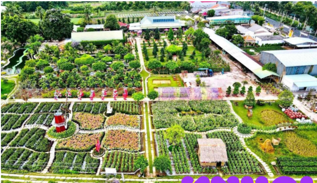
Sadec bonsai garden khu du lịch hoa kiêng sa ?éc ??ng th?p