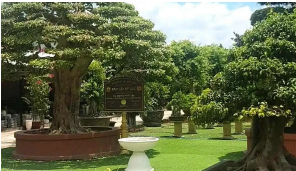
Sadec bonsai garden khu du lịch hoa kiêng sa dec video