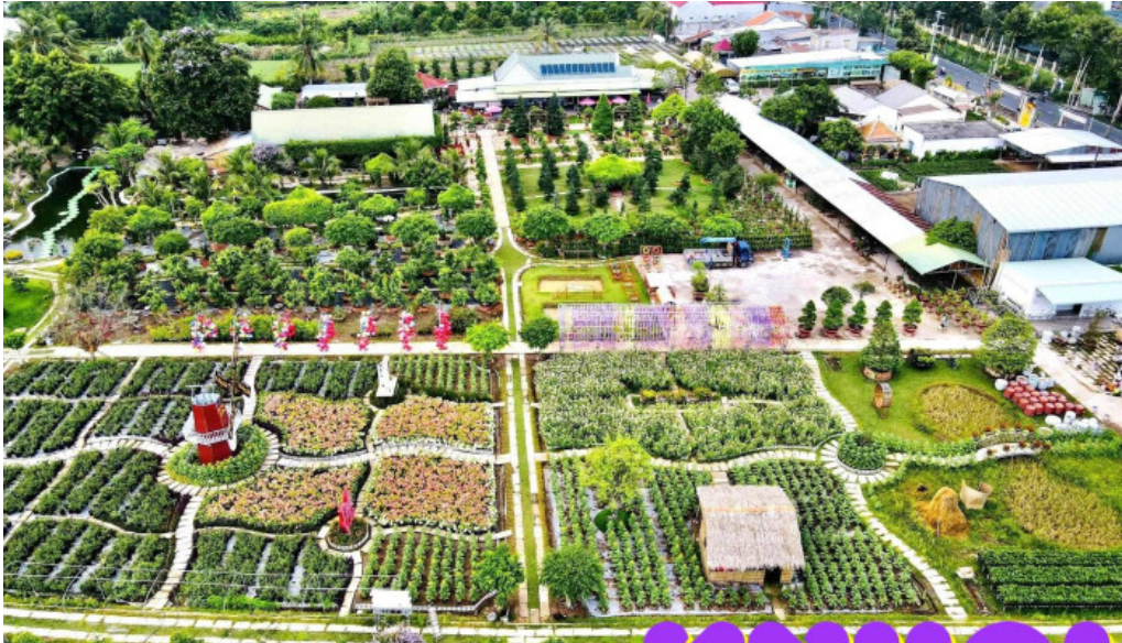
Sadec bonsai garden khu du lịch hoa kieng sa dec tat ca