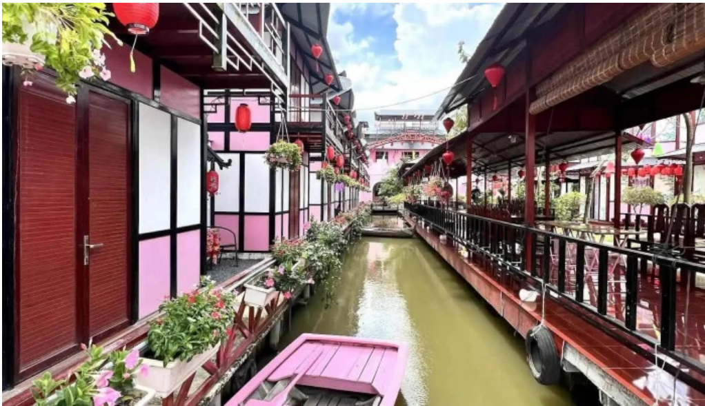
Nha mau hong moi nhat