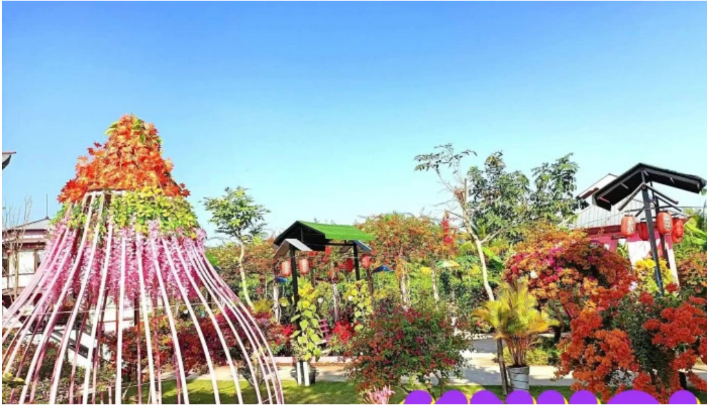
Nha mau hong tat ca