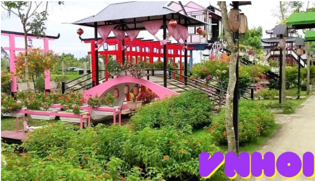
Nha mau hong video