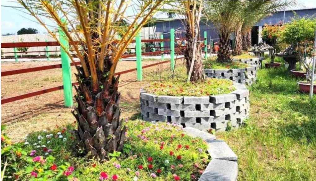
Khu du lịch sinh thái hào phát farm tat ca