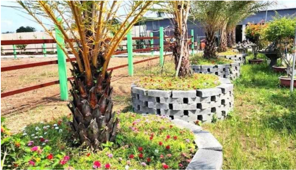
Khu du lịch sinh thái hao phat farm ??ng thạp