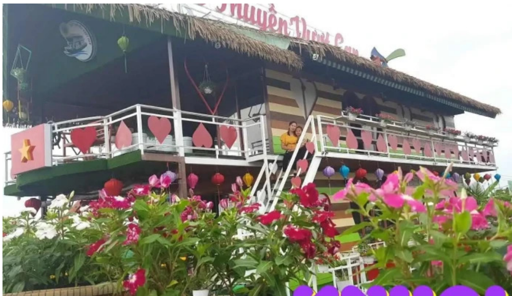
Du thuy?n v??t c?n sa ?ec ??ng thap ??ng thap