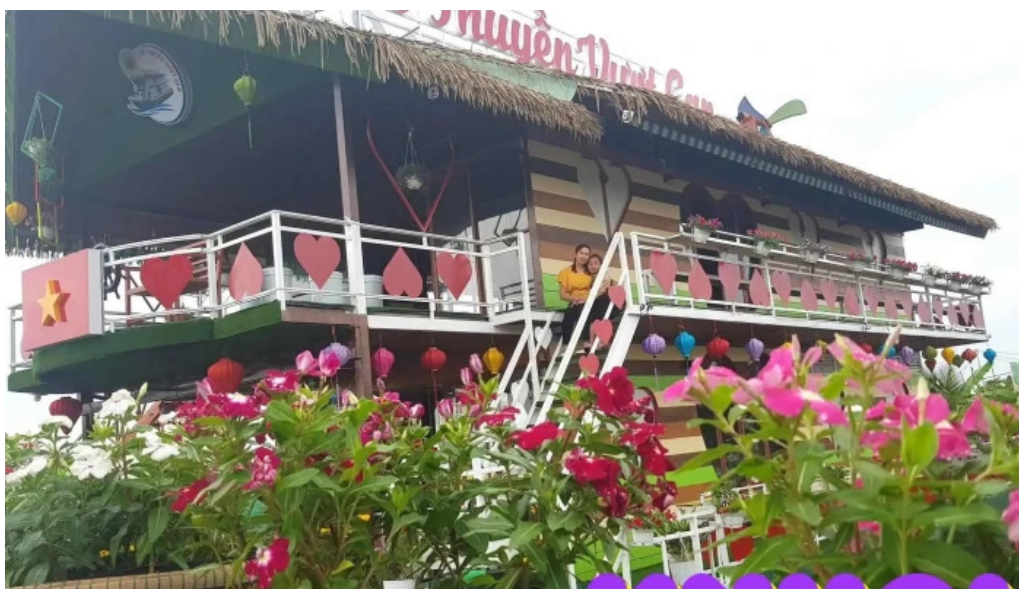
Du thuyen vuot can sa dec dong thap tat ca