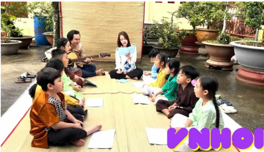
Cho ma dinh yen video