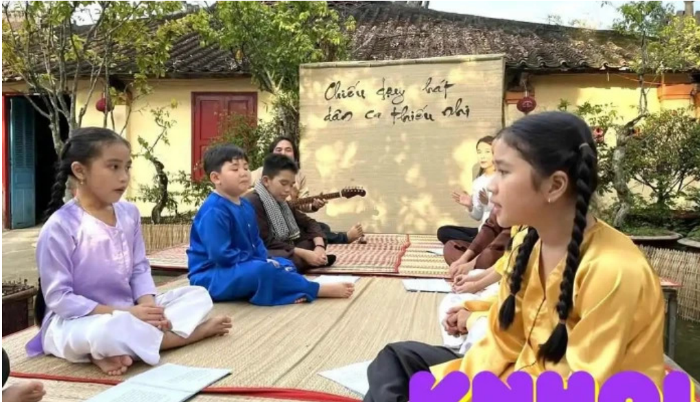
Ch? ma ??nh yen ???ng th?p