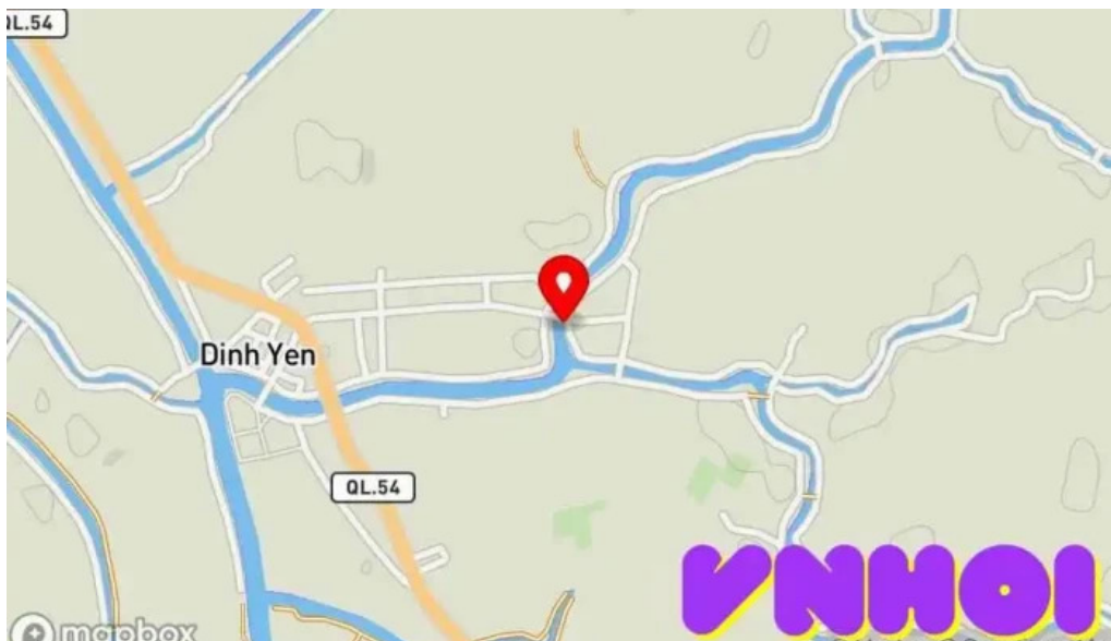
Cho ma dinh yen b?n ??