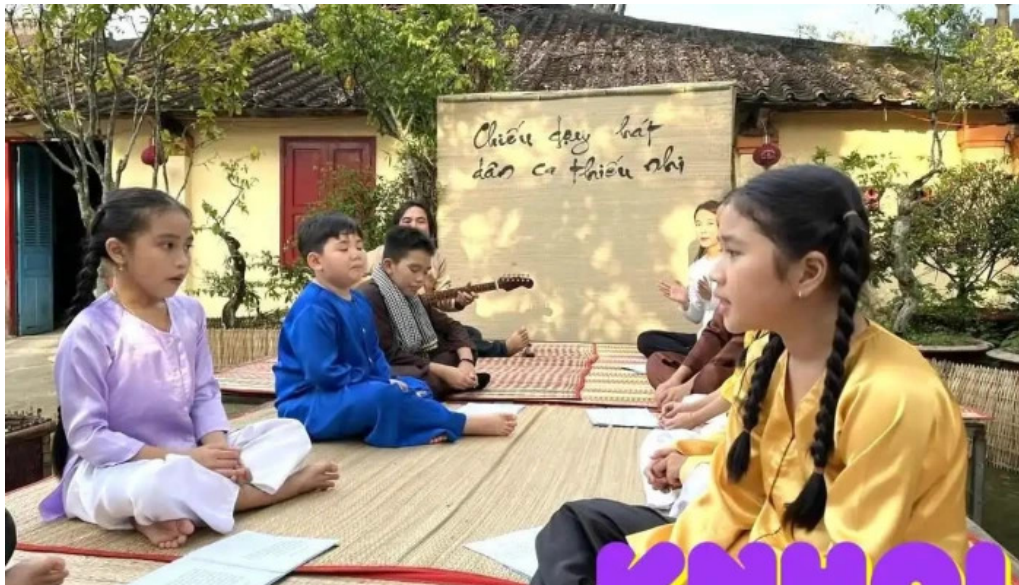
Cho ma dinh yen tat ca