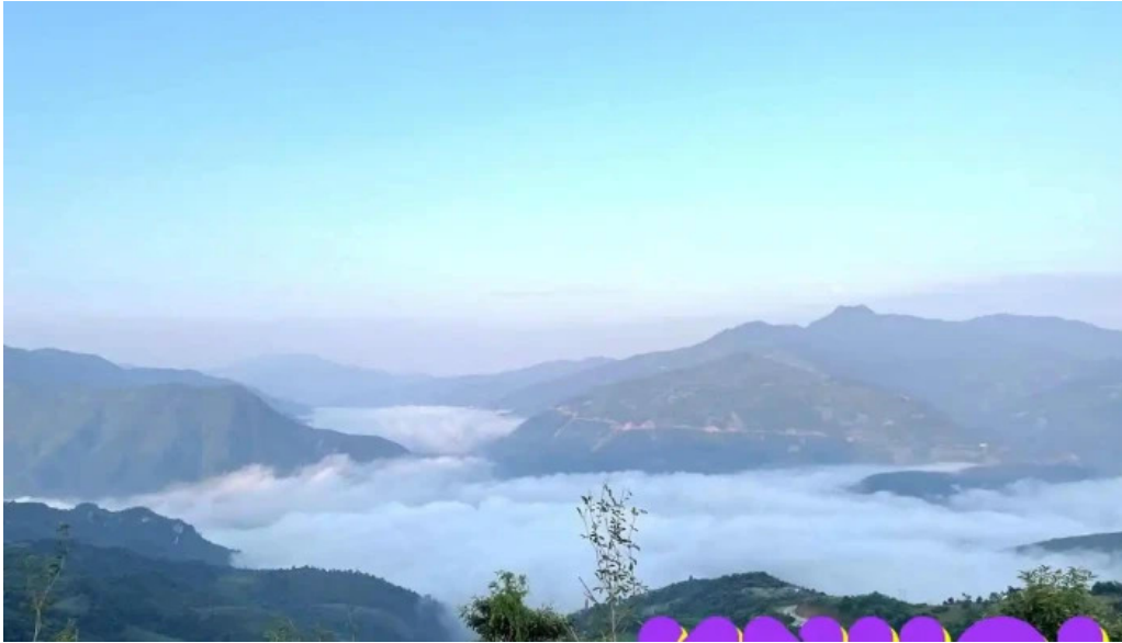
Thị trấn sương mù và ngắm hoàng hôn ở Cầu Lộ Yên Bái