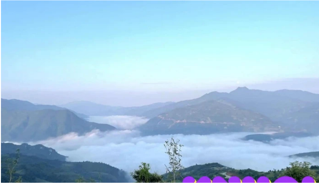
Diem san may va ngam hoang hon ke cai tat ca