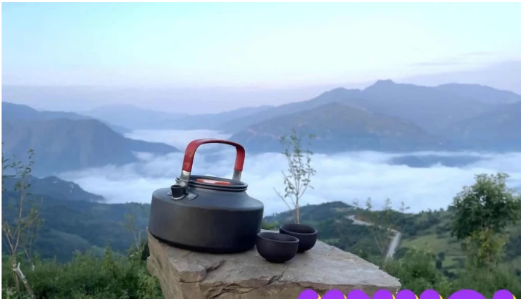
Diem san may va ngam hoang hon ke cai nui