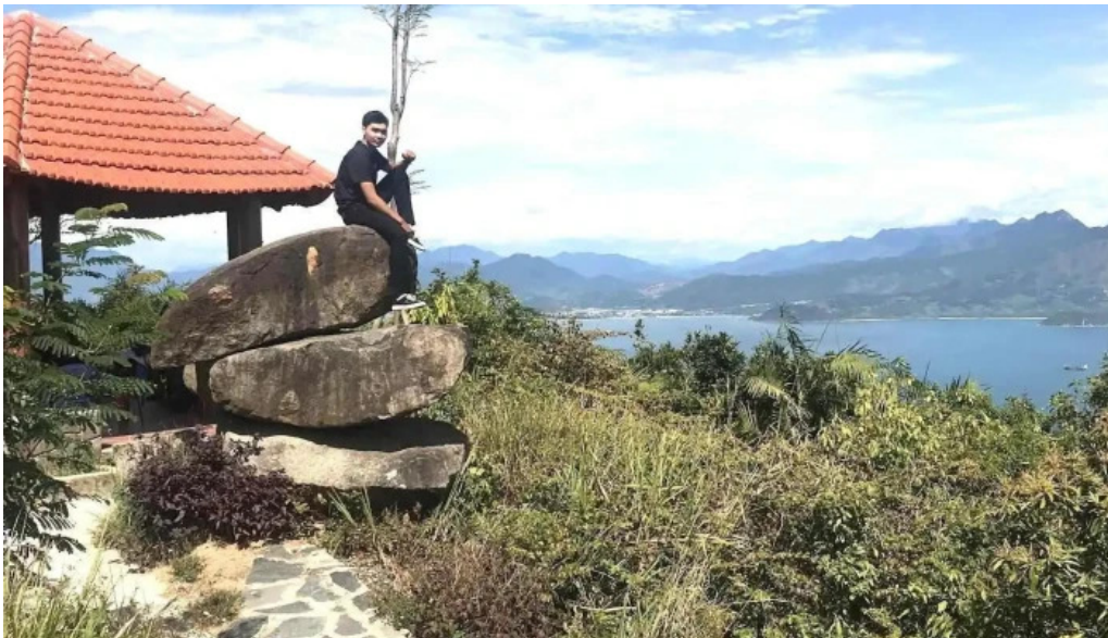
Nha vong canh nui