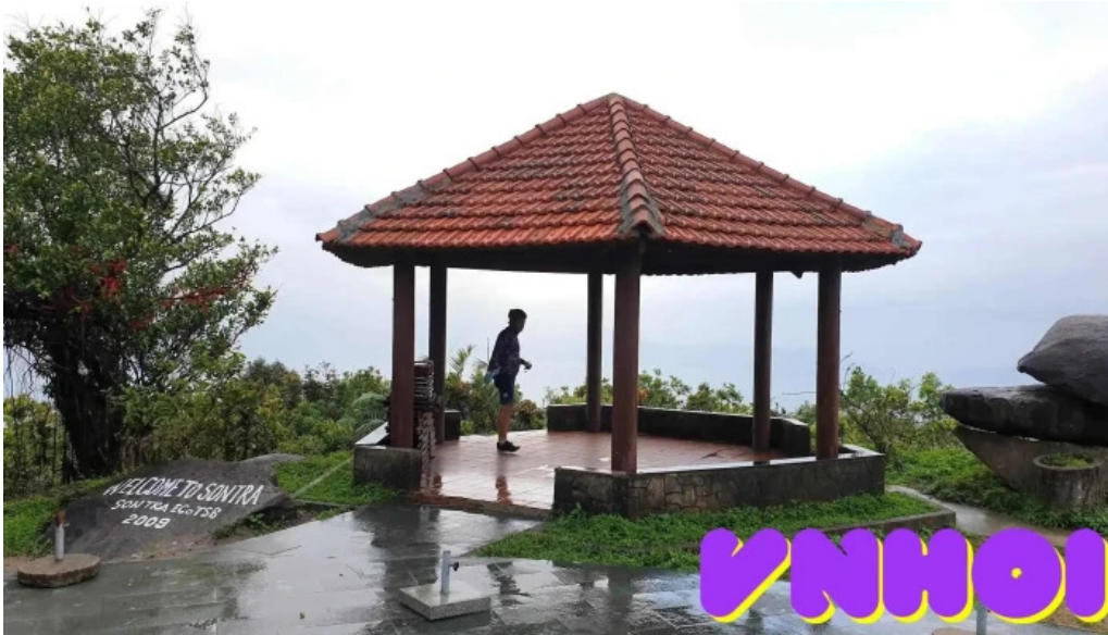
Nha vong canh tat ca