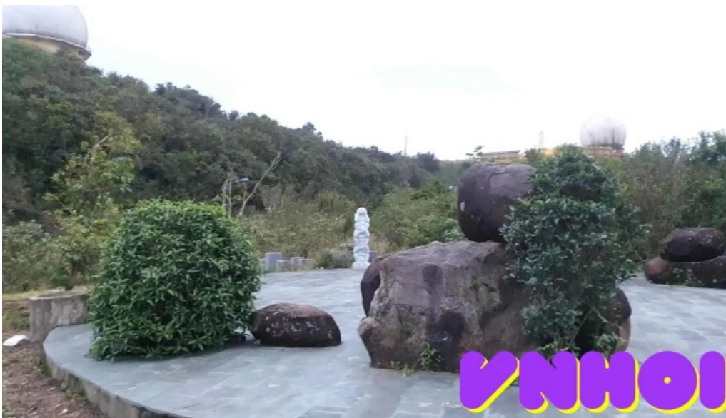
Nha vong canh video