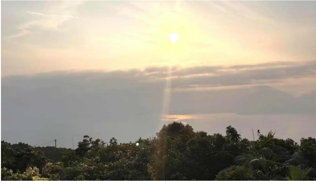
Nha vong canh moi nhat