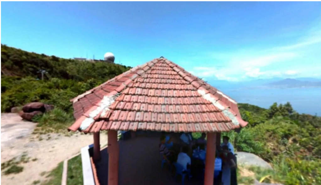
Nha vong canh che do xem pho va 360deg