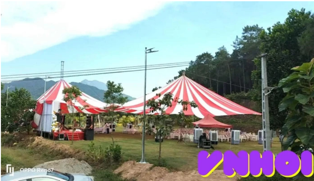
Encamp diem cam trai du lich trai nghieng video