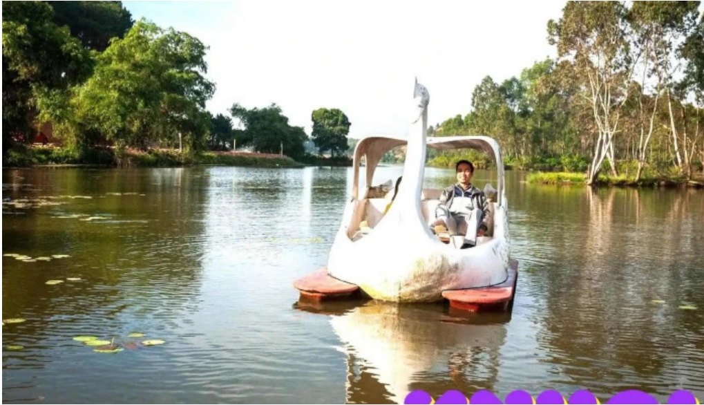
Encamp diem cam trai du lich trai nghiem tat ca