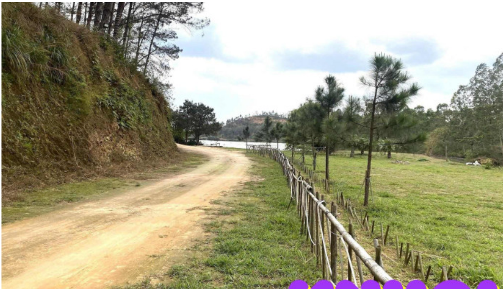
Encamp diem cam trai du lich trai nghiem moi nhat