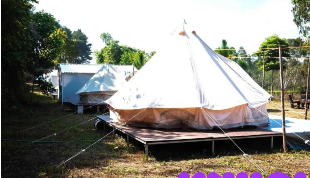
Encamp diem cam trai du lich trai nghiem cua chu so huu