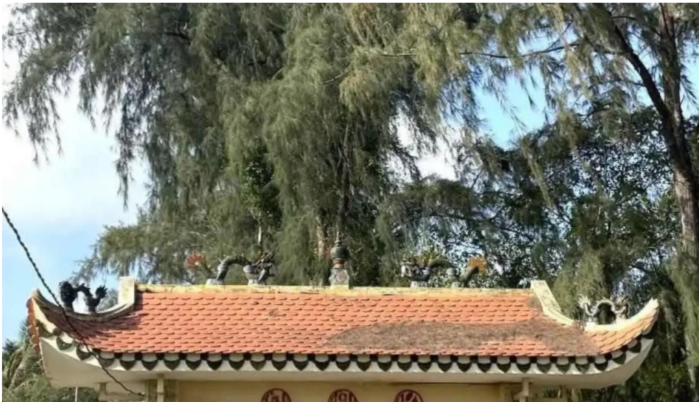
Lang hoang gia moi nhat