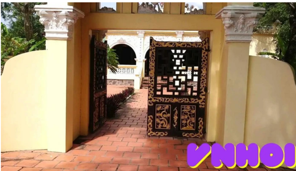
Lang hoang gia video