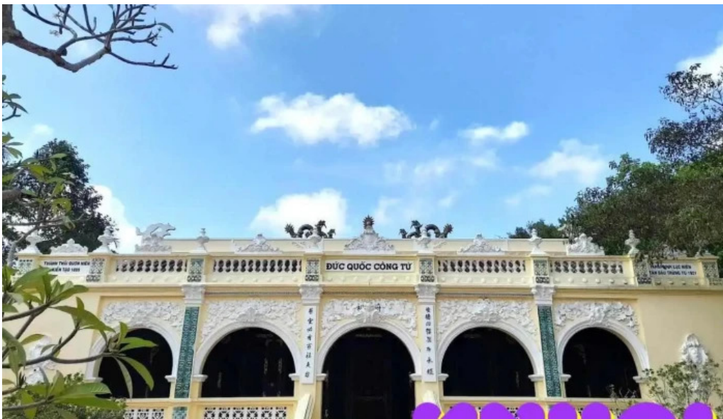
L?ng hoang gia ti?n giang