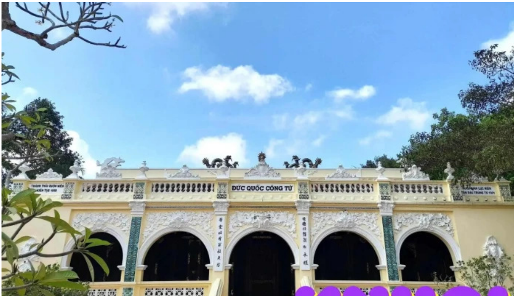
Lang hoang gia tat ca