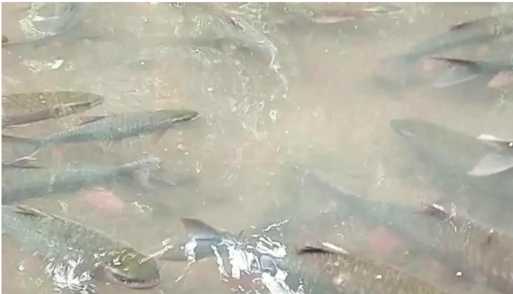
Suoi ca than cam lien moi nhat