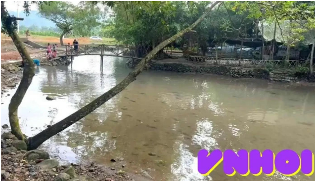
Suoi ca than cam lien video