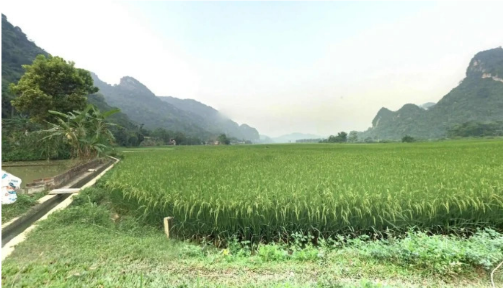
Suoi ca than cam lien che do xem pho va 360deg