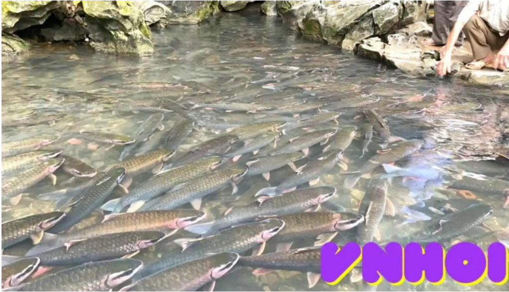
Su?i ca th?n c?m lien thanh hoa