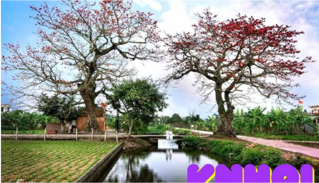
Cay g?o ?oi thai binh