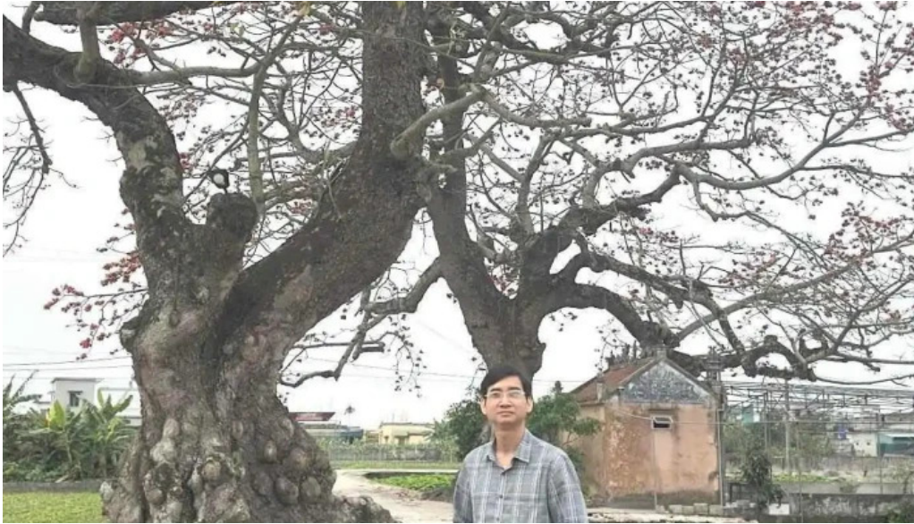
Cay gao doi moi nhat