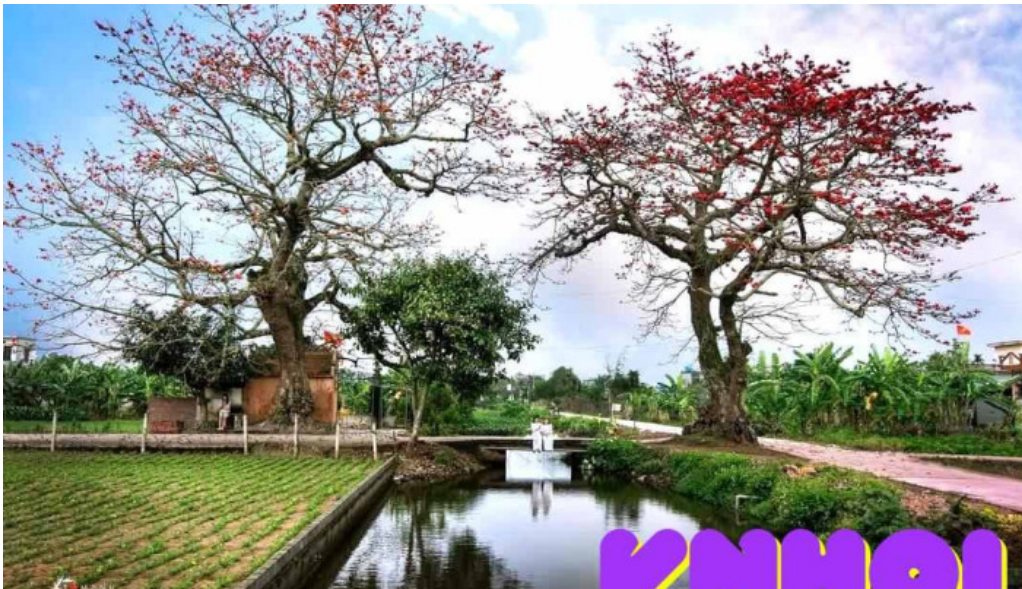
Cay gao doi tat ca