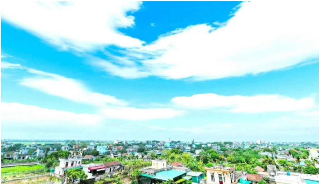
Cay gao doi che do xem pho va 360deg