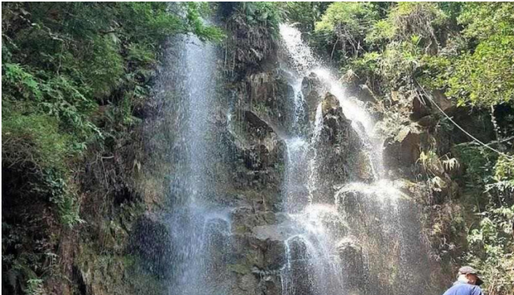
Khe song thác b?c yen t? qu?ng ninh