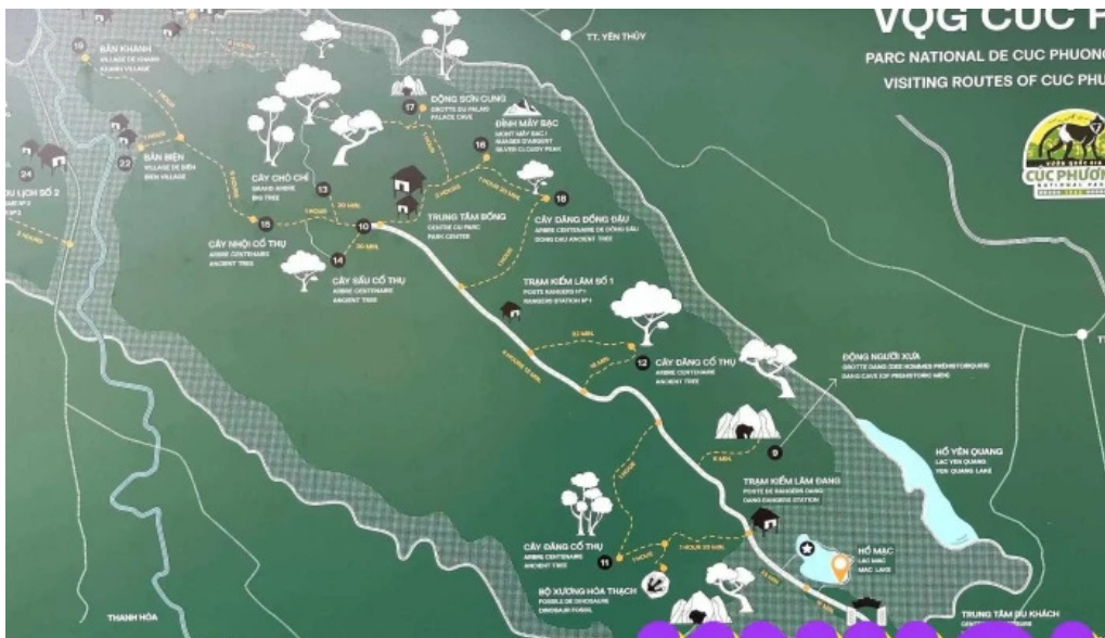
Dong ngoi xua ban quan ly vqg cuc phuong