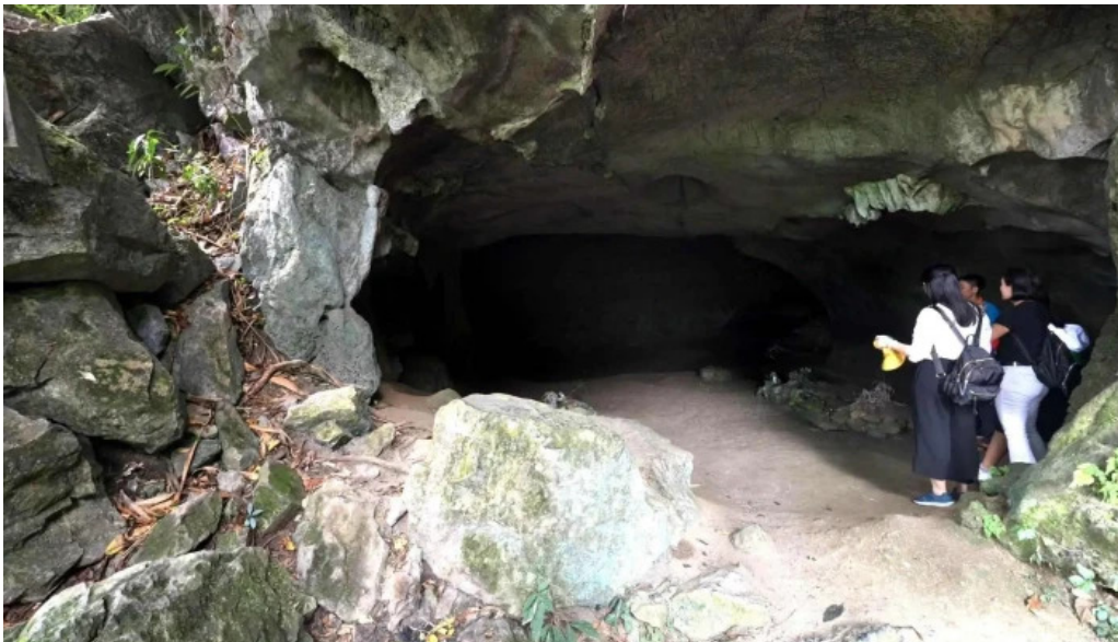
Dong nguoi xua che do xem pho va 360deg