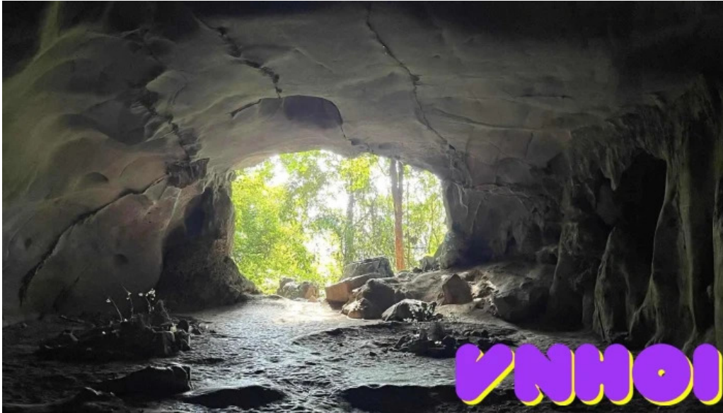
Dong nguoi xua tat ca