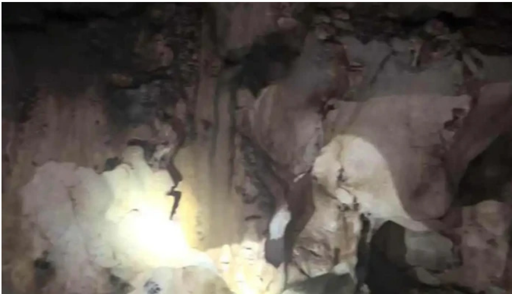
Dong nguoi xua video