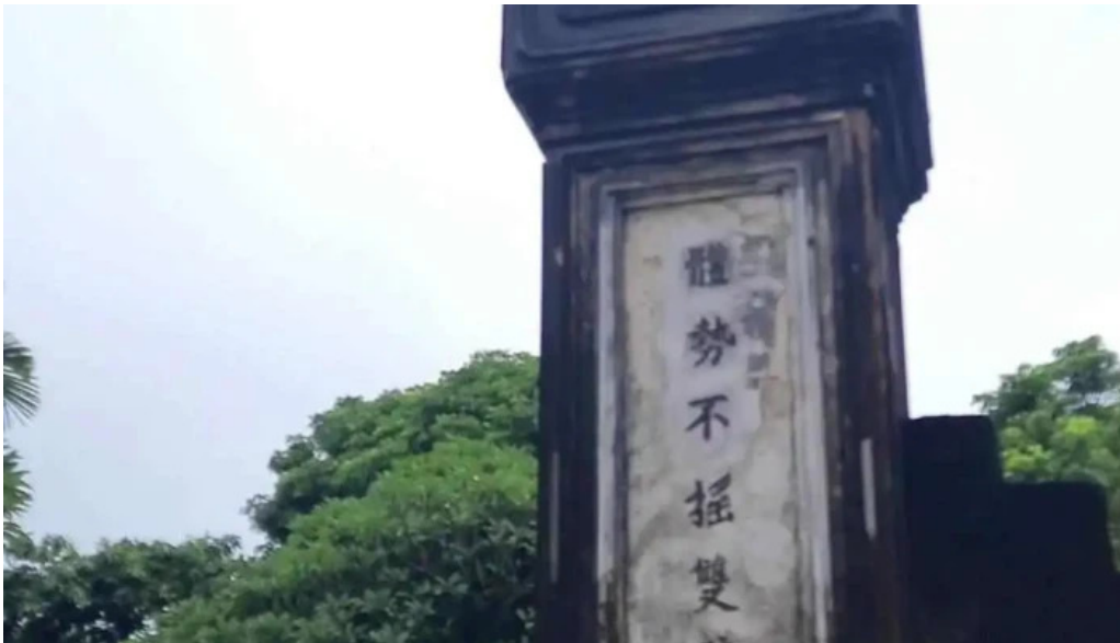
Co do hoa lu den tho vua dinh tien hoang