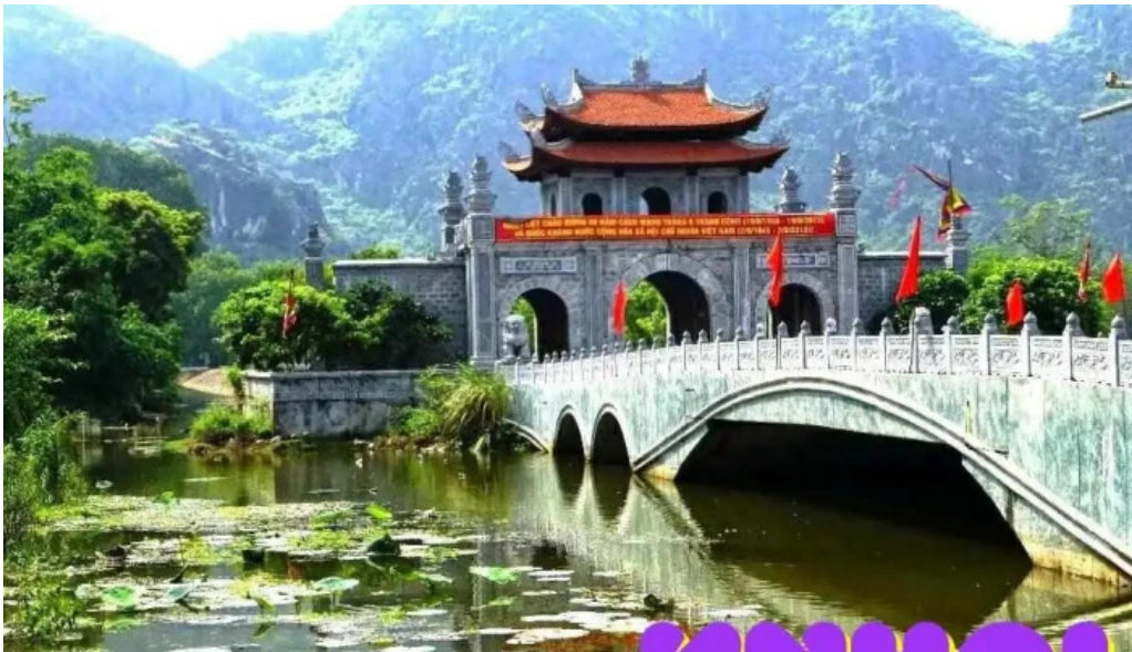
Co do hoa lu nui