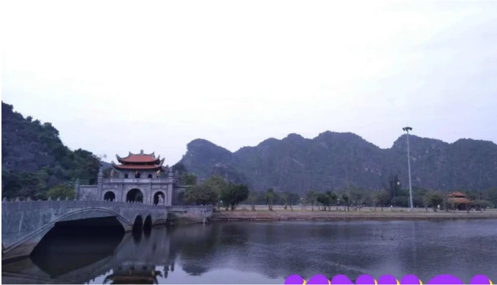
Co do hoa lu nha bia ly thai to