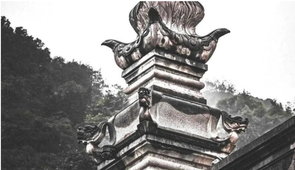
Co do hoa lu moi nhat