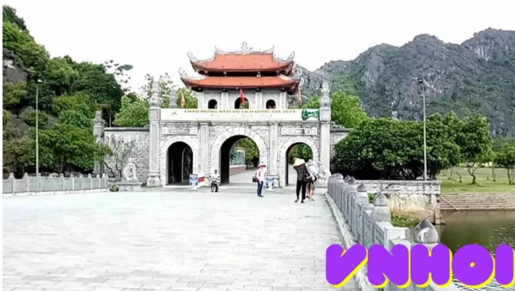
Co do hoa lu video