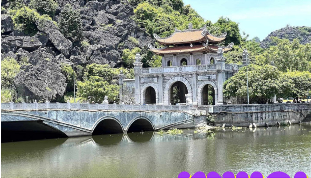
Co do hoa lu tat ca