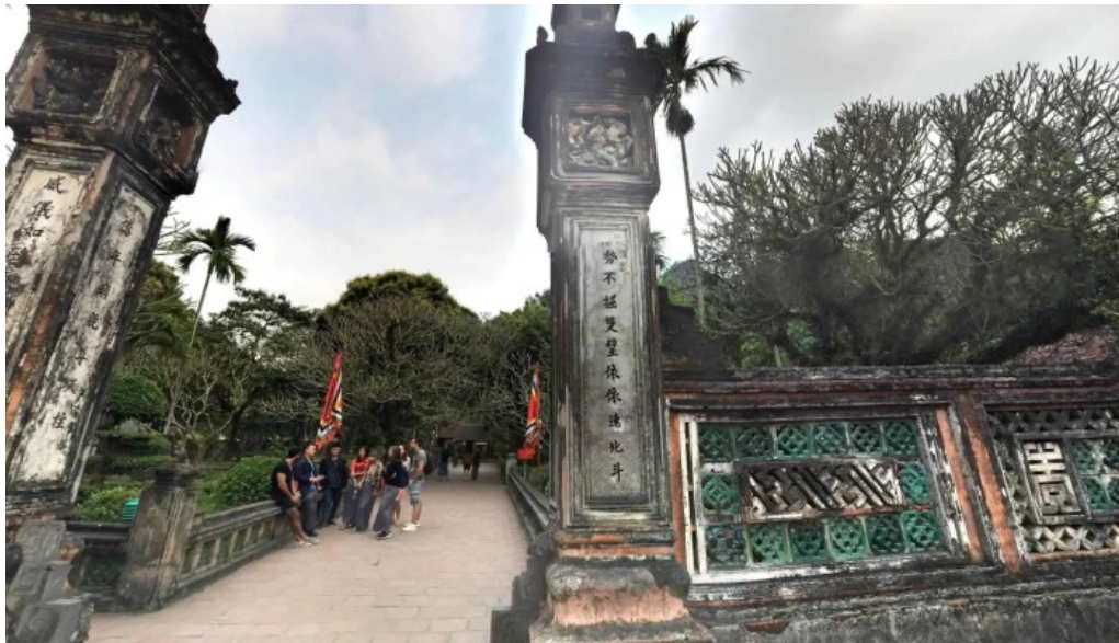
Co do hoa lu che do xem pho va 360deg