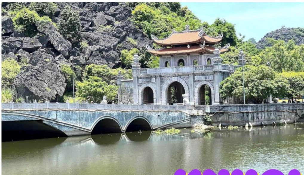
C? ?ô hoa l? ninh bình