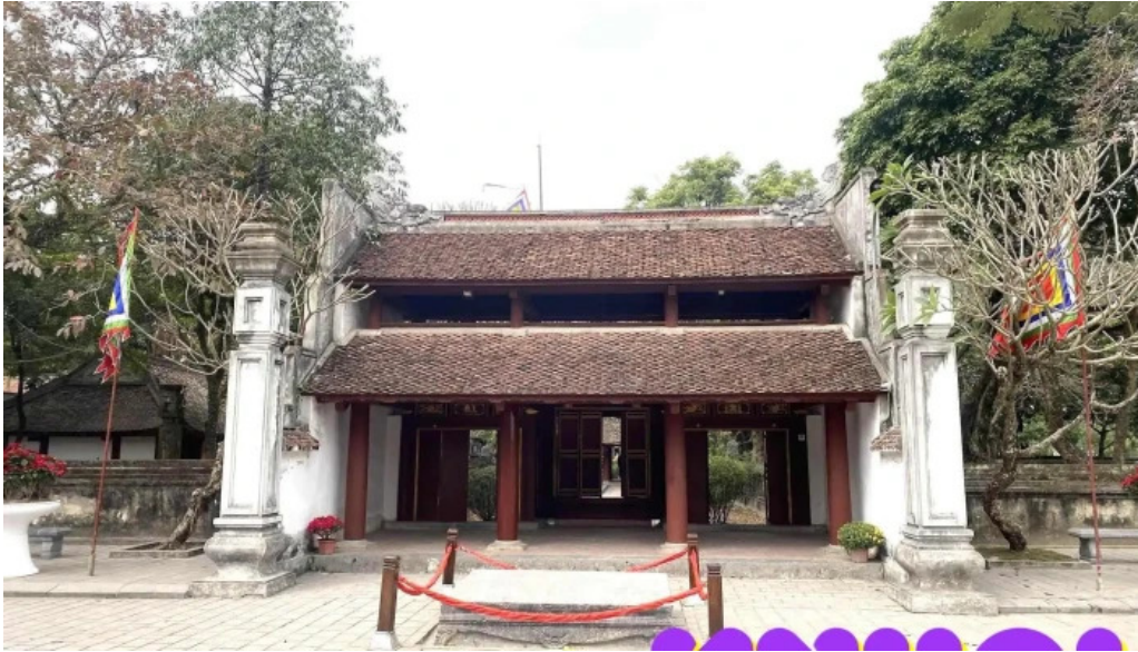
Co do hoa lu den tho vua le dai hanh