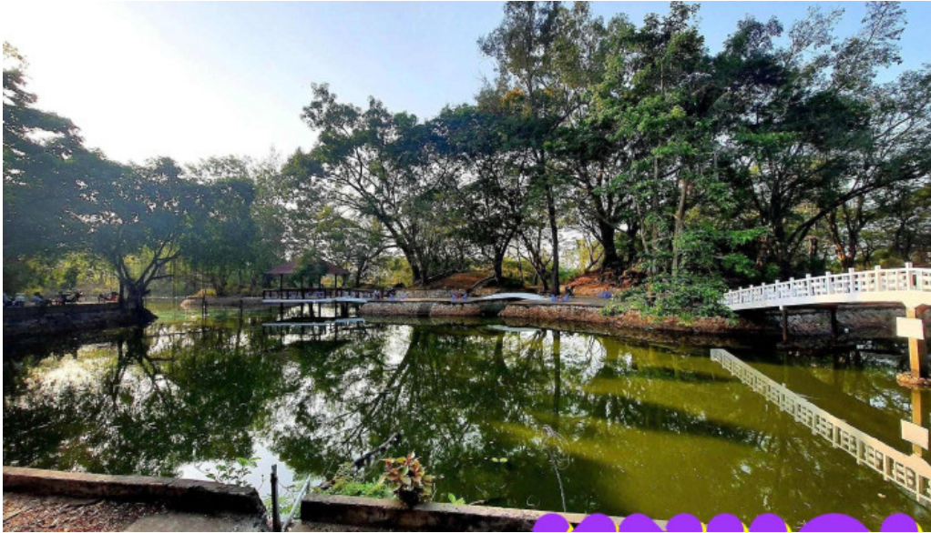
Khu di tích núi đất tát ca