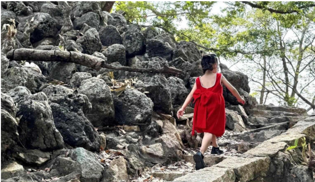
Khu di tích núi đất moi nhát