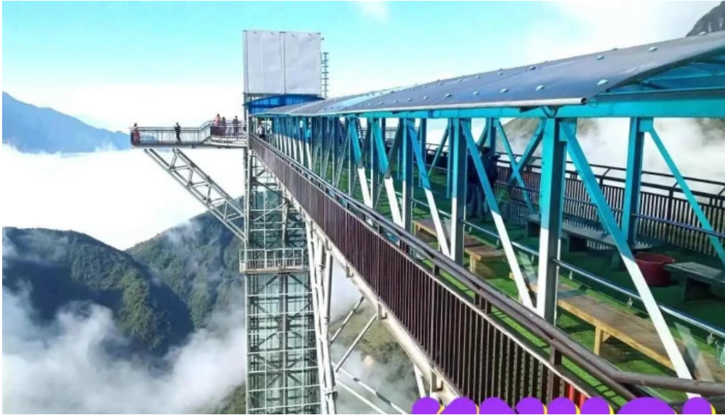
Khu du lịch cầu kính rong mây tat ca