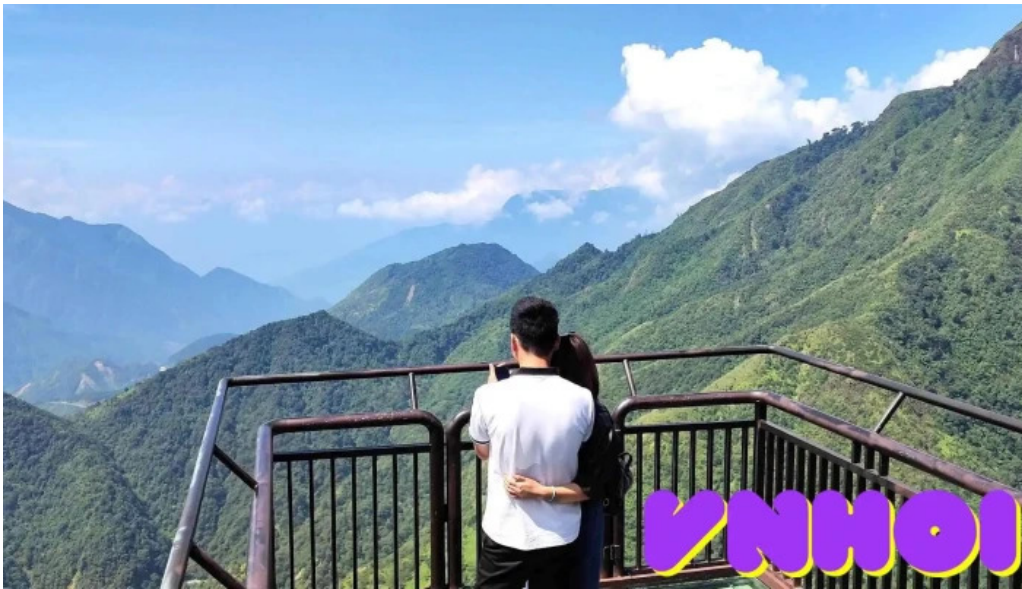
Khu du lịch cầu kính rong mây núi