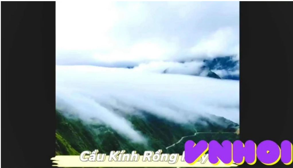
Khu du lịch cầu kính rồng mây của chu so huu