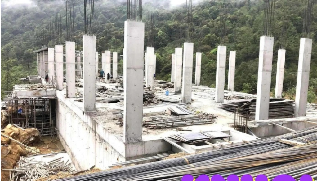
Khu du lịch cầu kính rồng mây mọi nhat