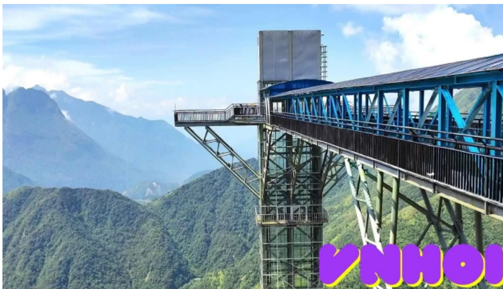
Khu du lịch cầu kính rong may video