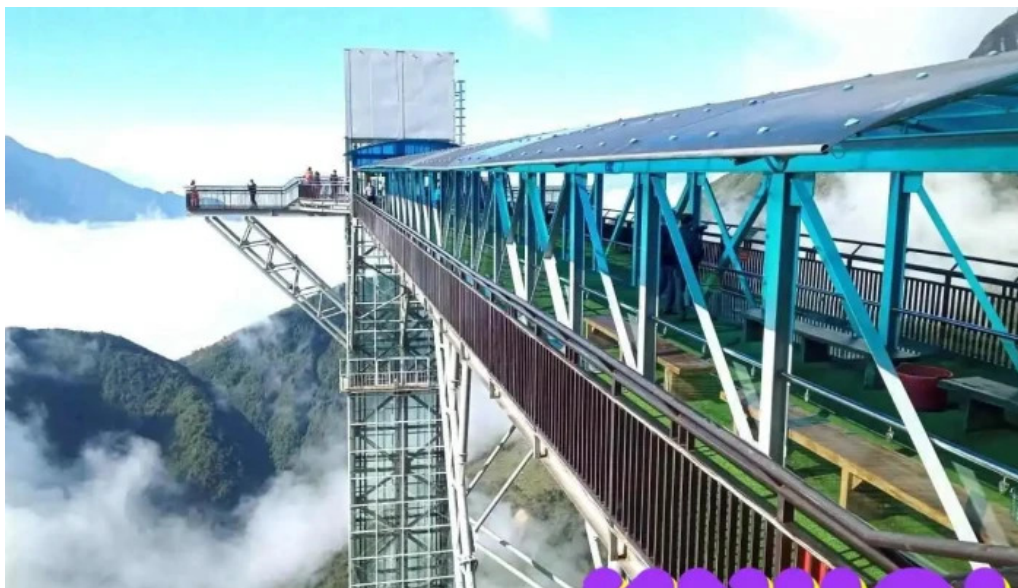
Khu du l?ch c?u kinh r?ng may lao cai