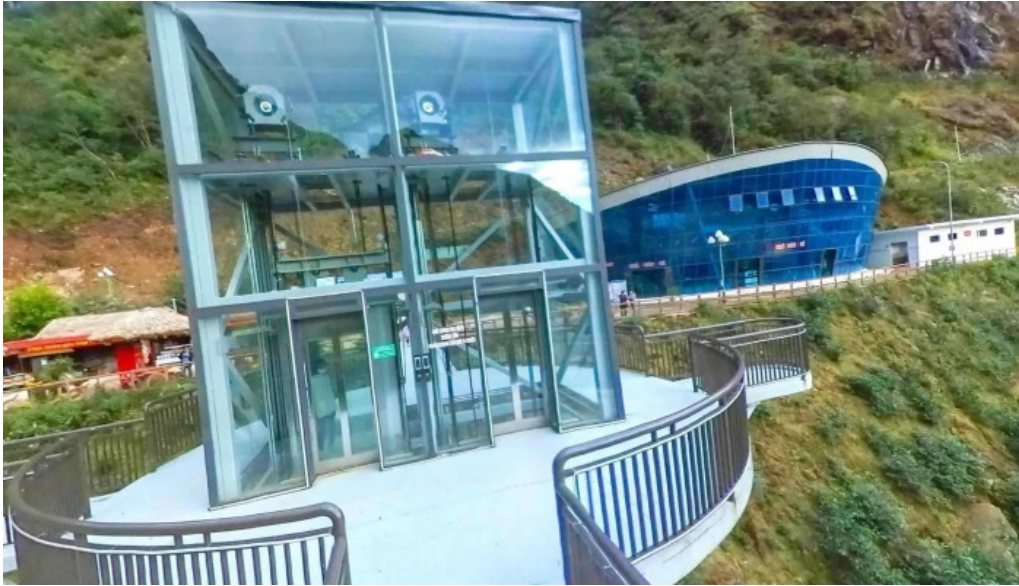
Khu du lịch cầu kính rong may che do xem pho va 360deg