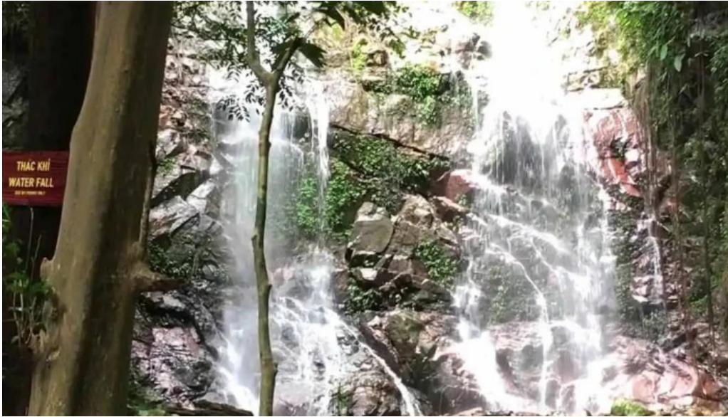
Trung tam du lich sinh thai video