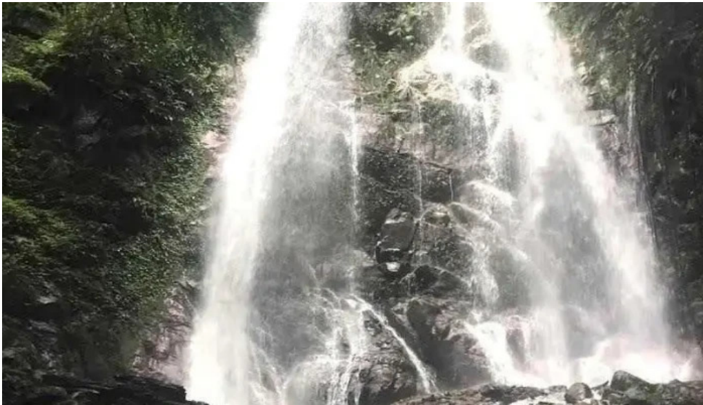
Trung tam du l?ch sinh thai kon tum