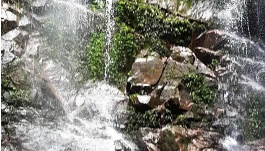
Trung tam du lich sinh thai cua chu so huu