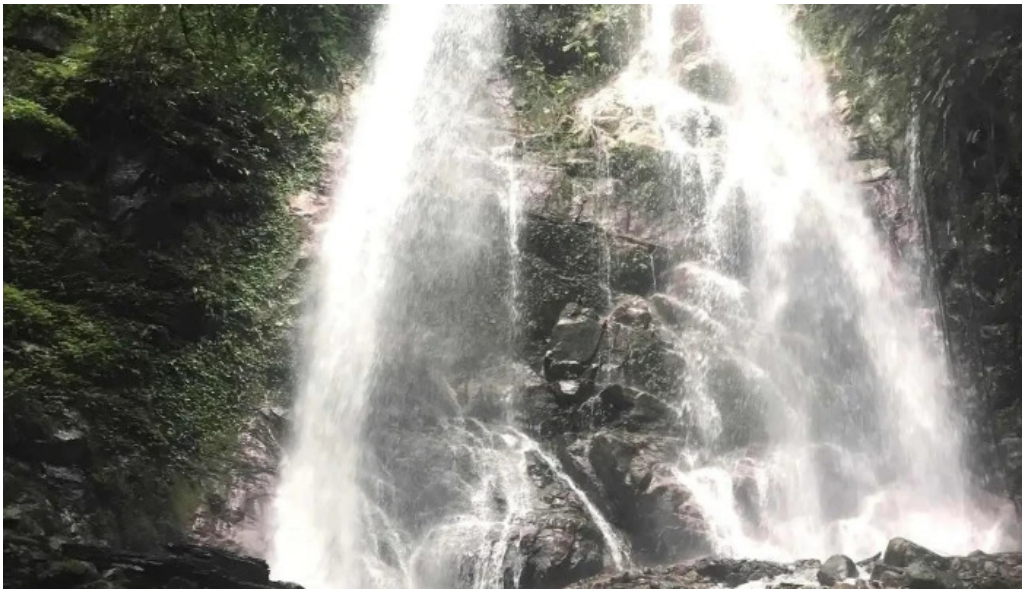
Trung tam du lich sinh thai tat ca