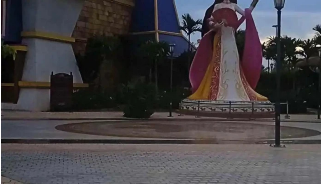
Khu du lịch quốc tế Đồi Rồng Video