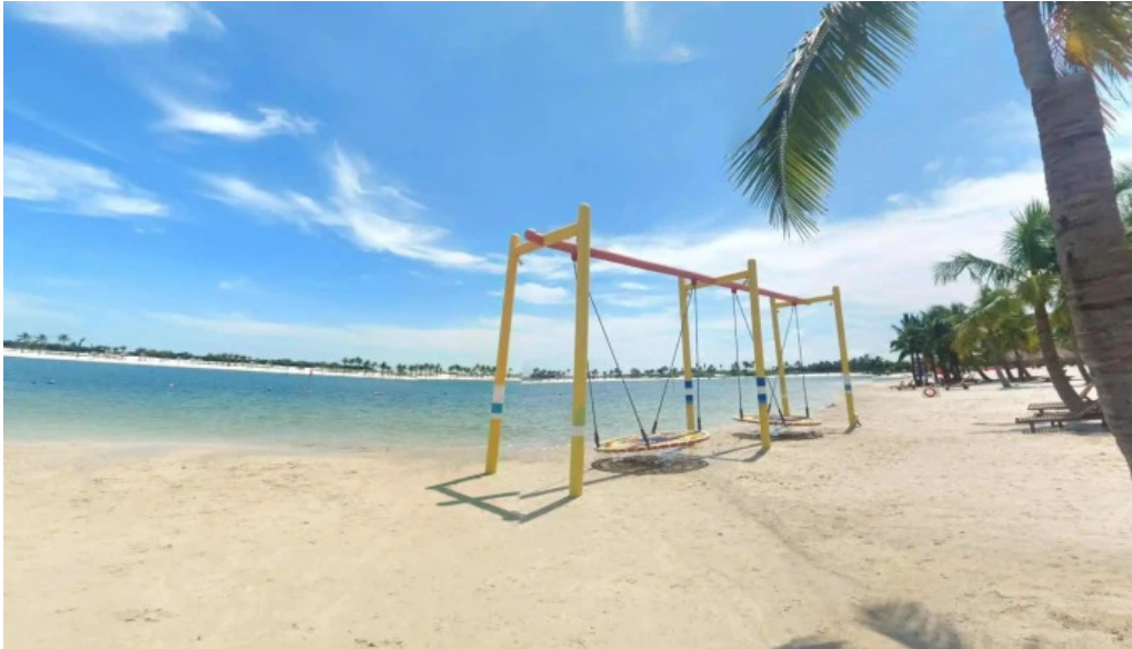
Khu du lịch quốc tế đôi rồng che do xem pho va 360deg