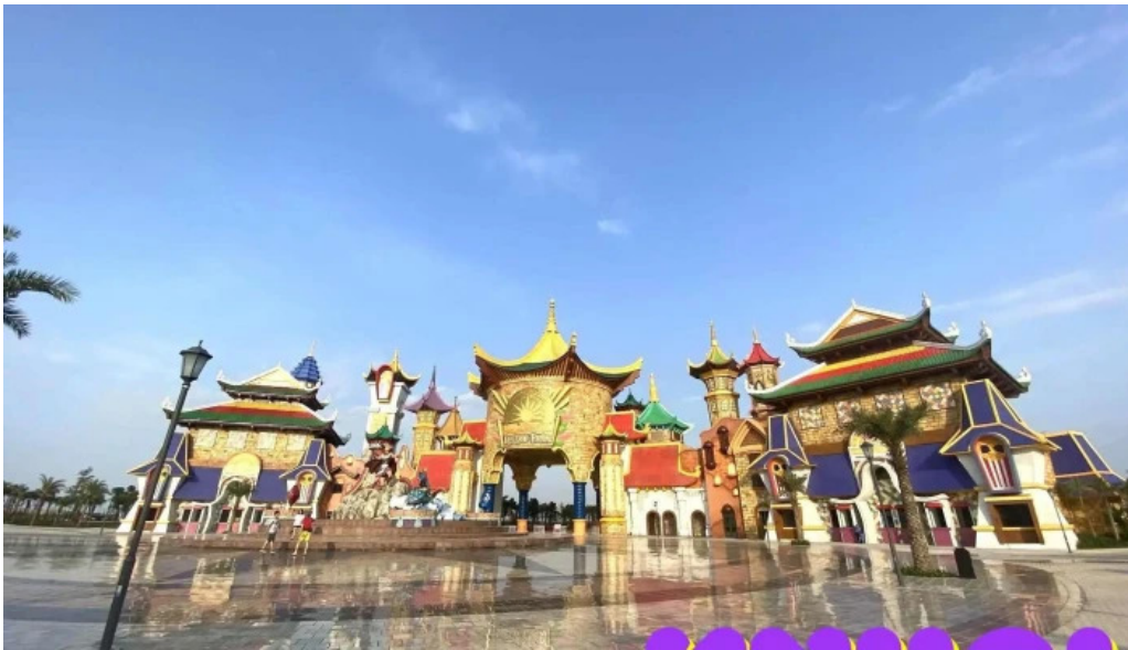
Khu du lịch quốc tế Đồi Rồng Tất Cả