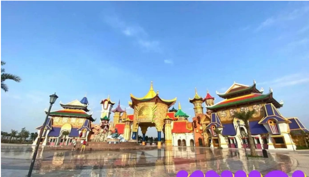
Khu du lịch quốc tế Hồ Chí Minh hiện phòng