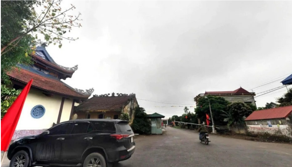
Dao co chi lang nam che do xem pho va 360deg