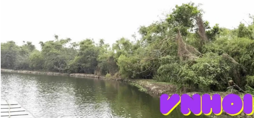
Dao co chi lang nam moi nhat