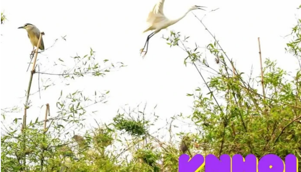
Đào chi Lăng nam hiện đại