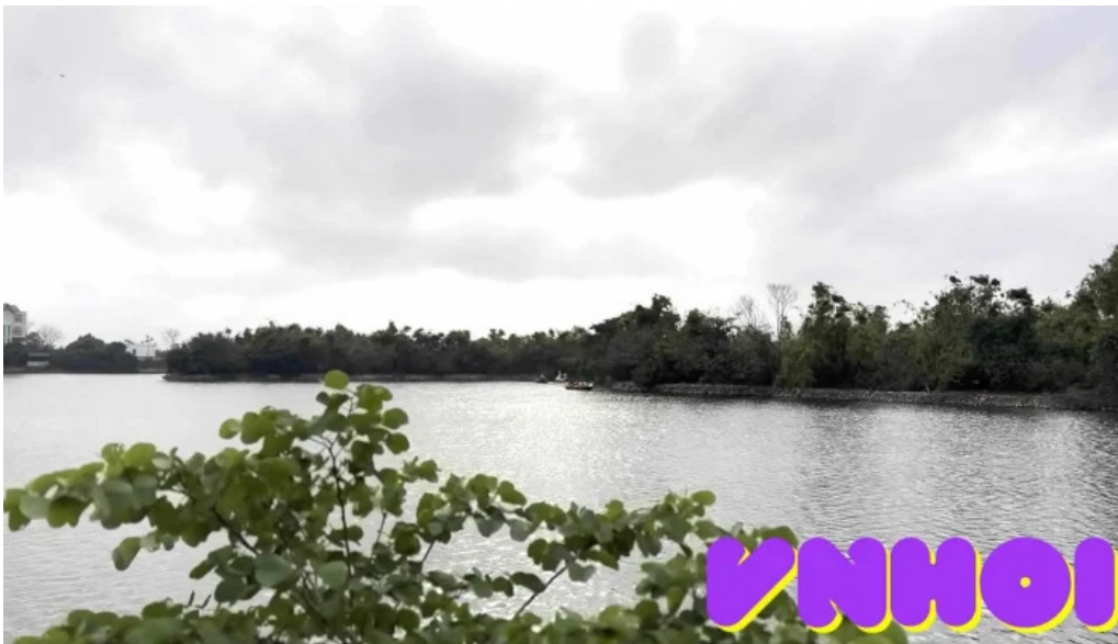
Đào chi Lăng nam video