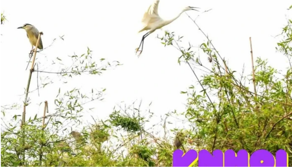
Dao co chi lang nam tat ca