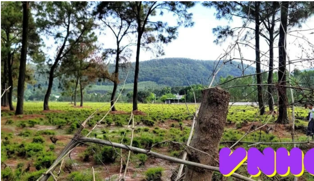
Bai re nui