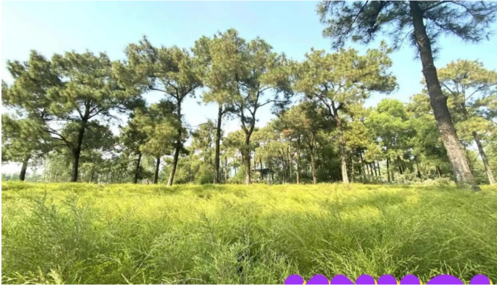
Bai re tat ca