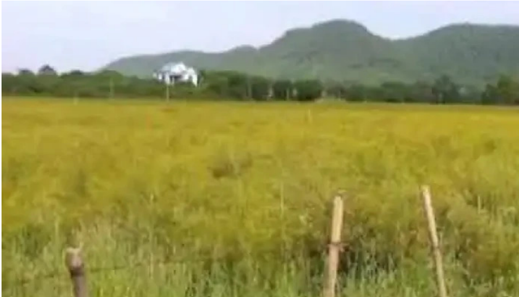
Bãi re mới nhất