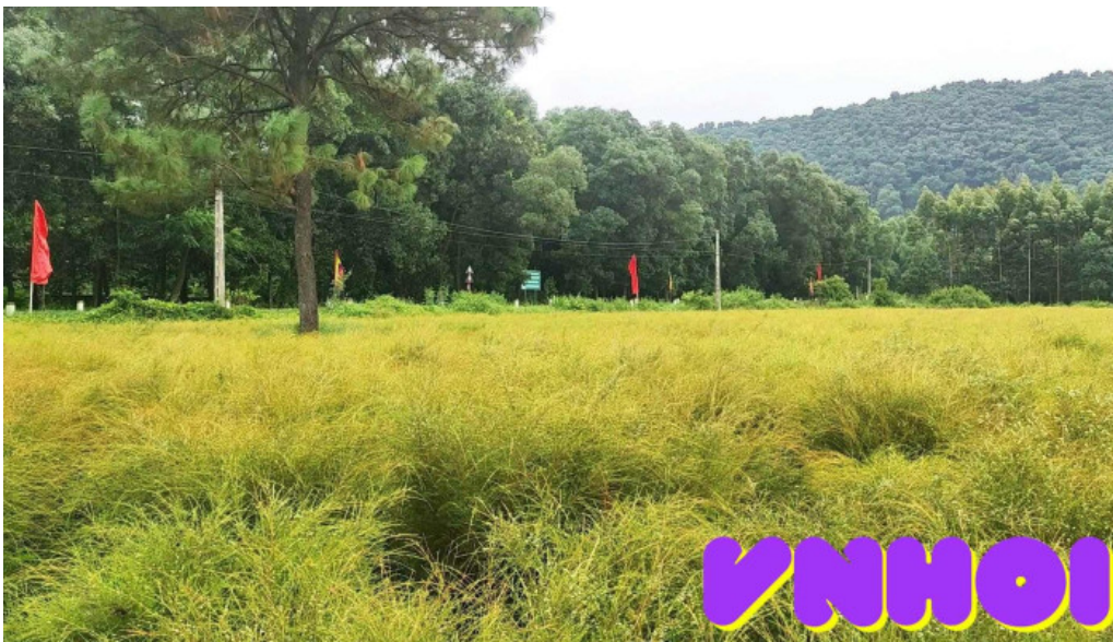
Bai re video