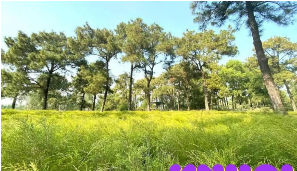
Bai r? h?i d??ng