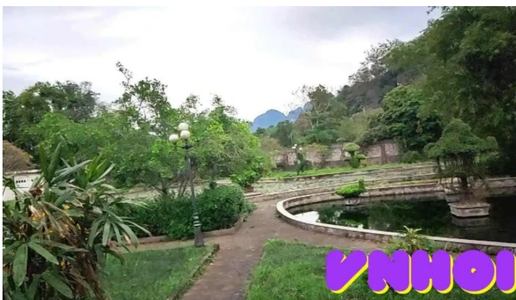
Khu du lịch suối khoáng kim boi video