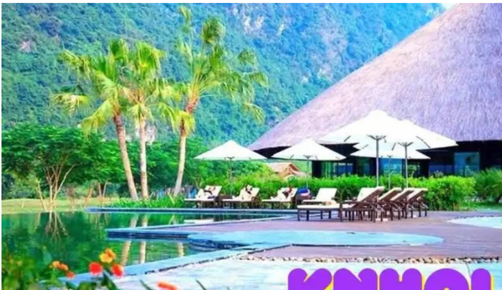
Khu du lịch suối khoáng kim boy núi