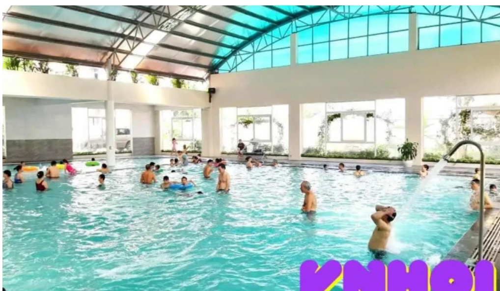
Khu du l?ch su?i khoang kim boi hòa bình