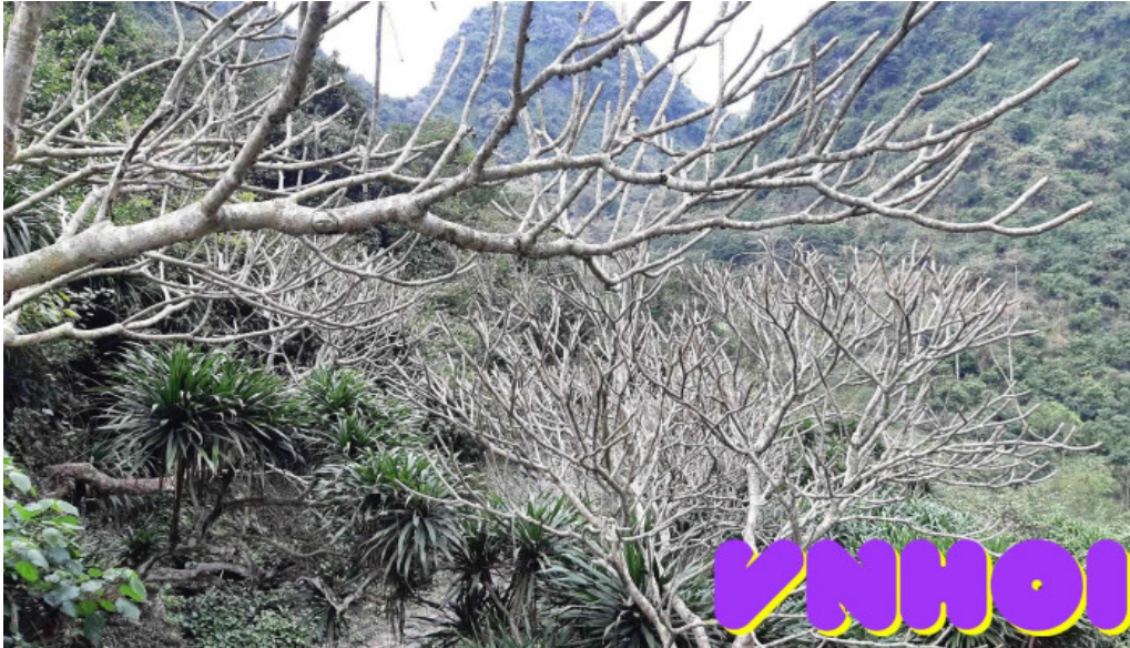
Dong long van nui