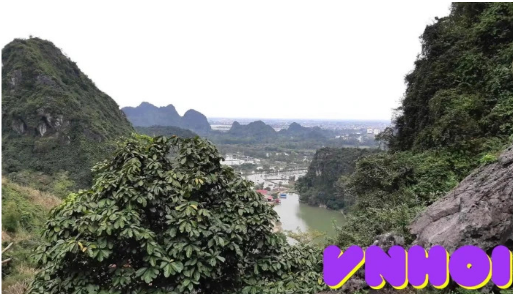
Dong long van tat ca