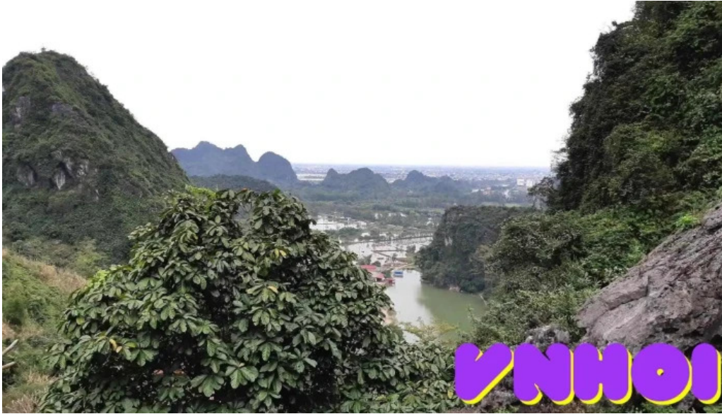
??ng long van ha n?i