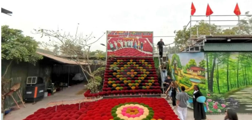
Tam hương long hoa che do xem pho va 360deg