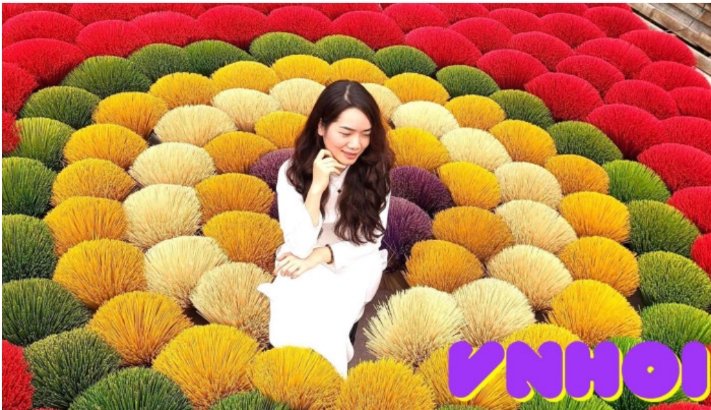
Tam hương long hoa của chủ sở hữu