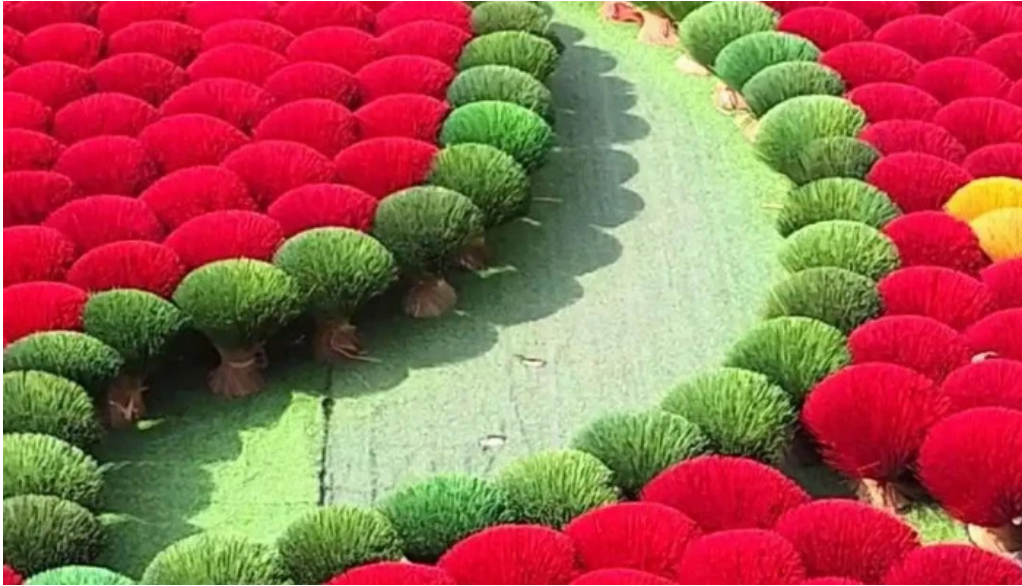
Tam huong long hoa video