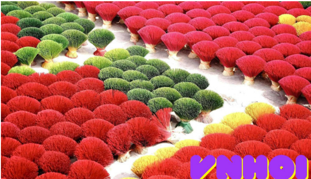
Tam huong long hoa tat ca