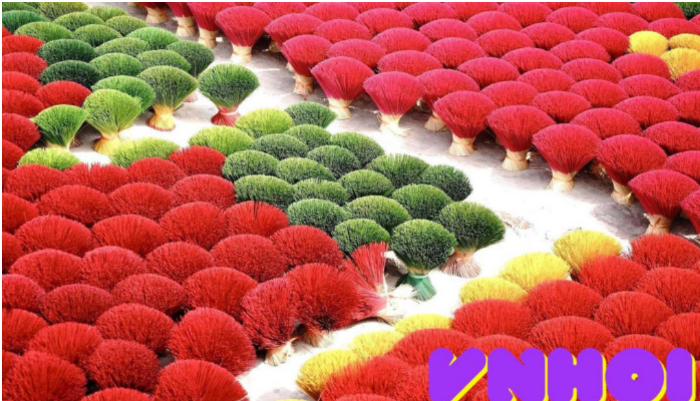
T?m h??ng long hòa ha n?i