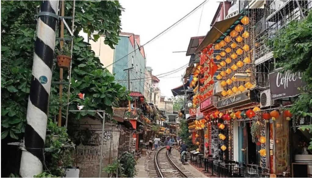
Pho duong tau ha noi tat ca