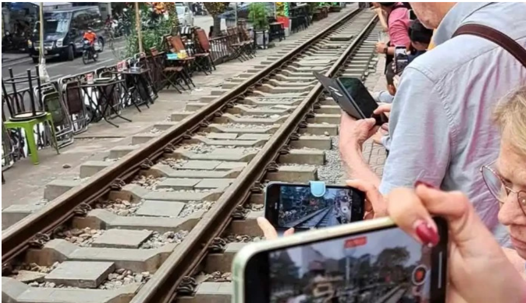
Pho duong tau ha noi moi nhat