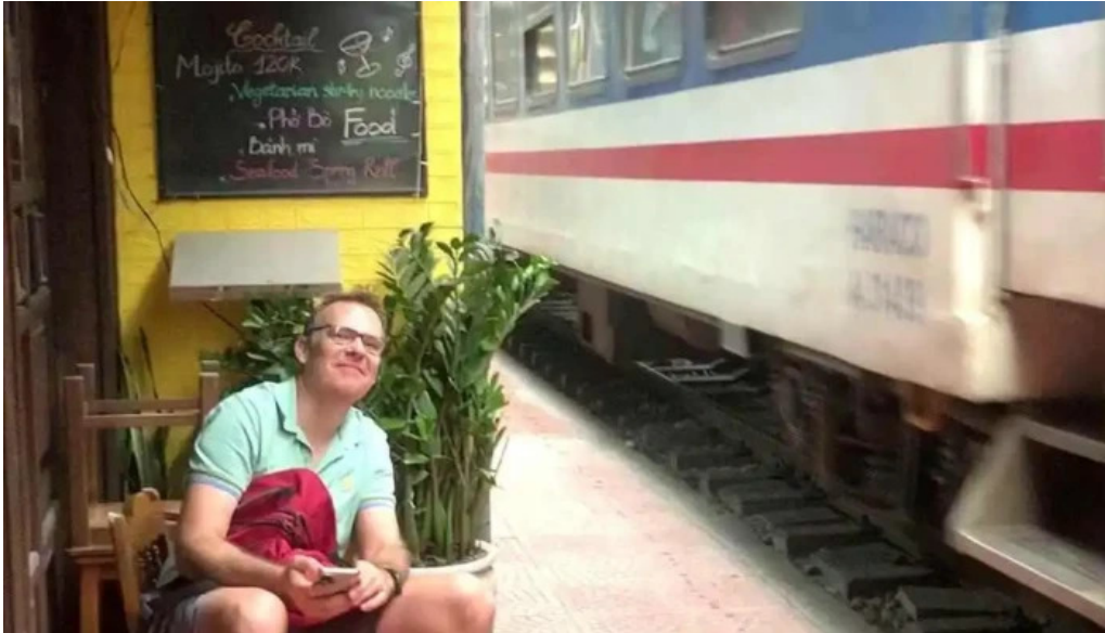
Pho duong tau ha noi cua chu so huu