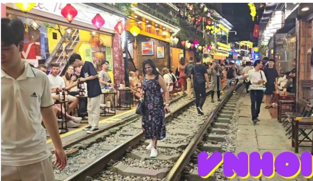
Pho duong tau ha noi video