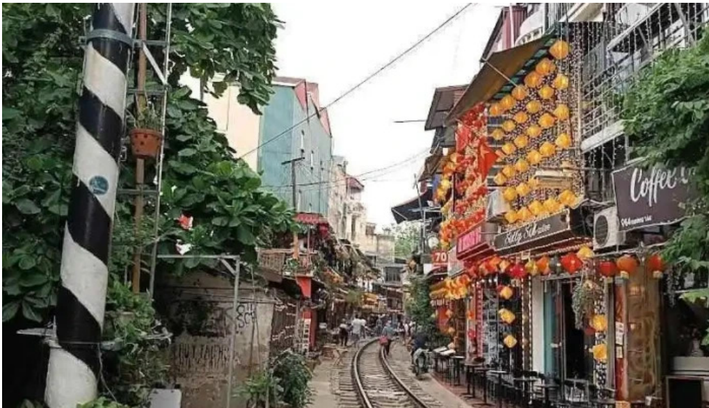
Ph? ???ng tau ha n?i ha n?i