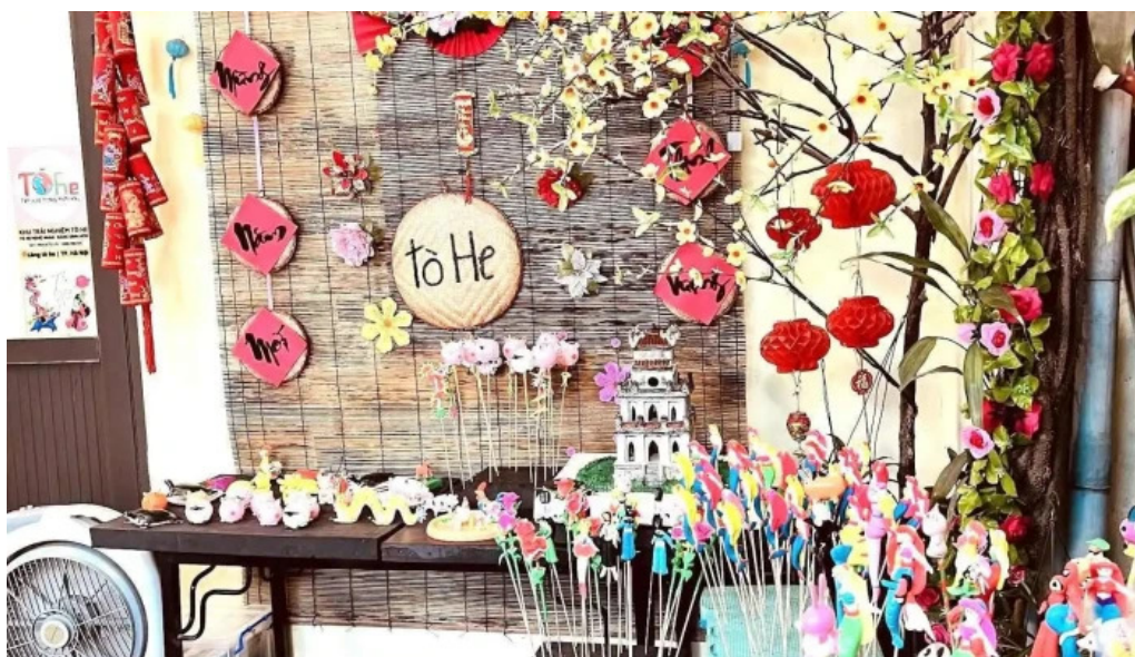
Nan to he lang nghe nan to he tat ca