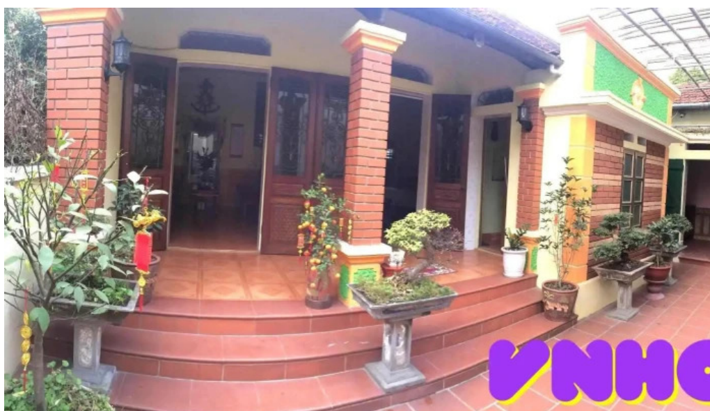
Nan to he lang nghe nan to he cua chu so huu