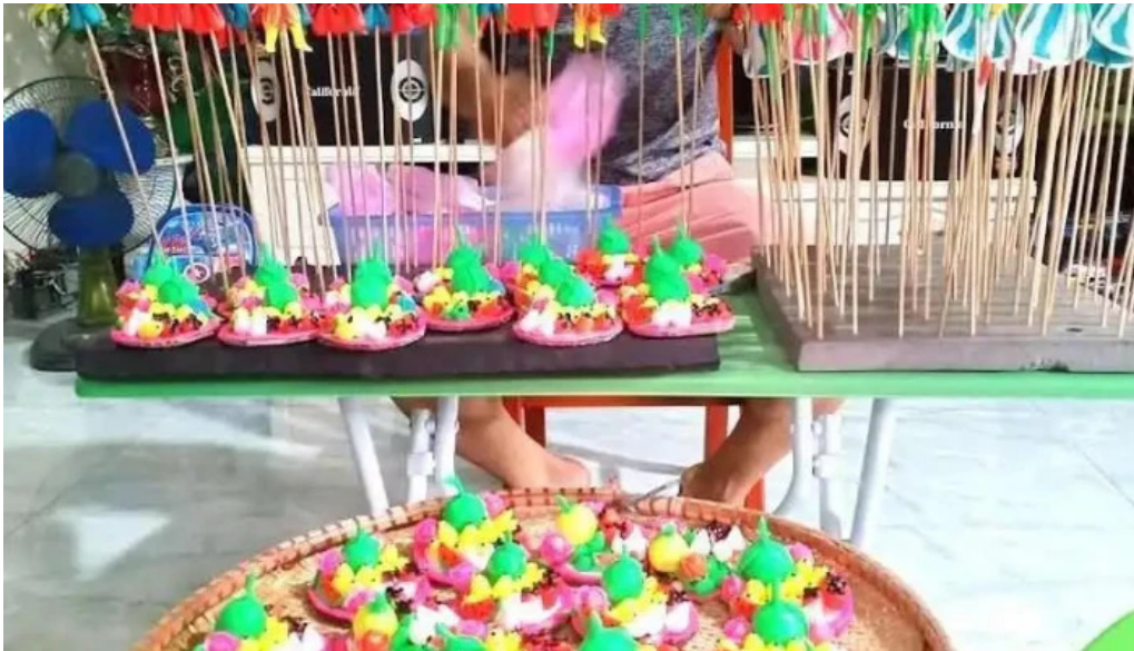
N?n tò he lang ngh? n?n tò he ha n?i