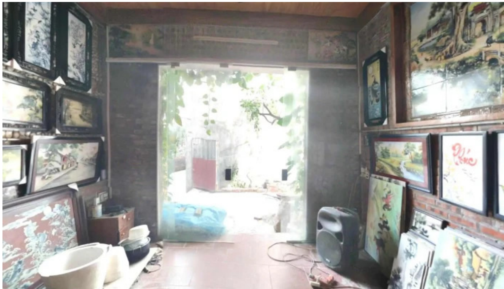
Lang gom bat trang che do xem pho va 360deg