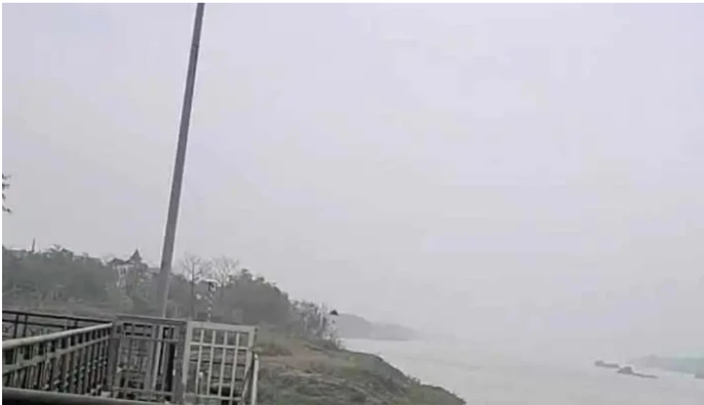
Lang gom bat trang moi nhat