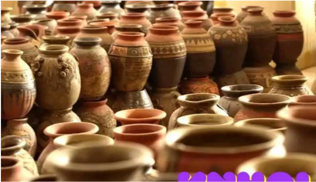
Lang g?m bat trang ha n?i