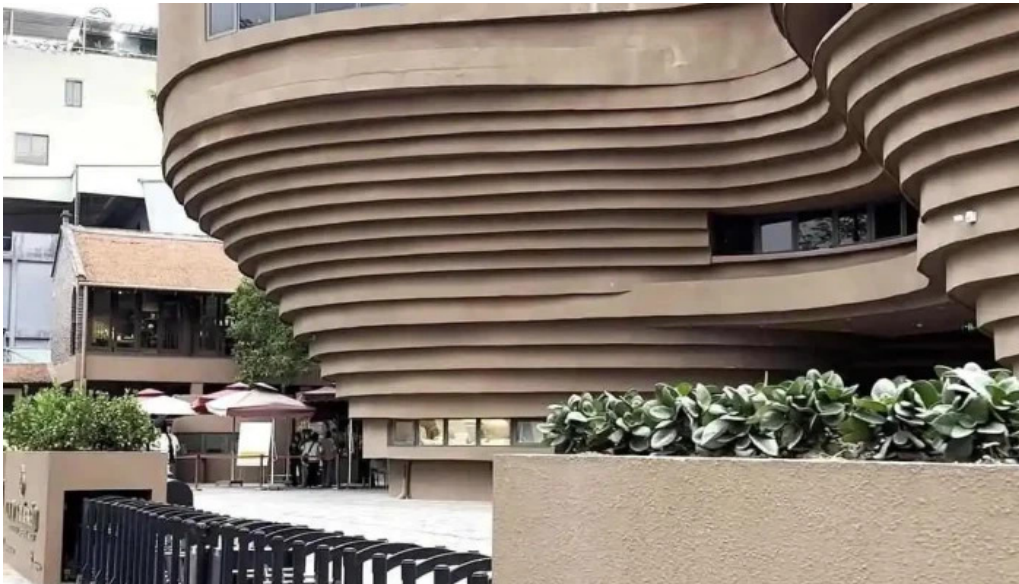
Lang gom bat trang video