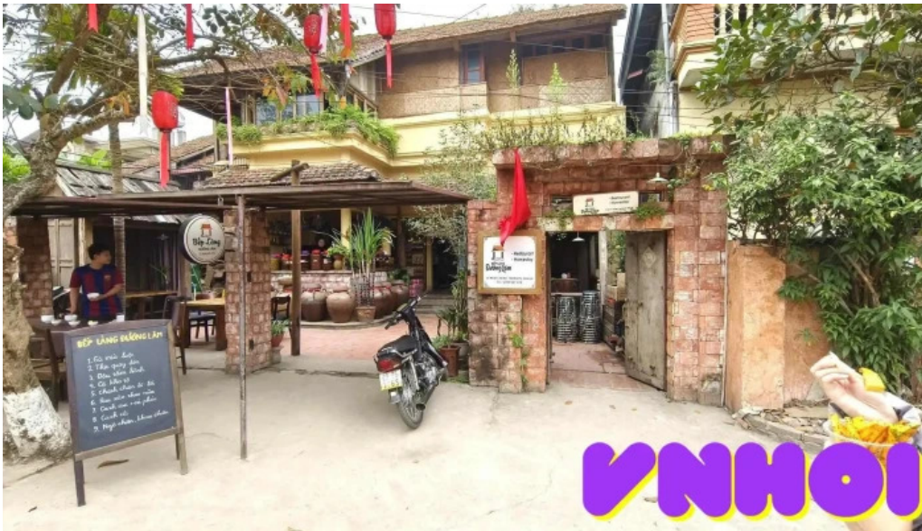
Lam co duong lam moi nhat