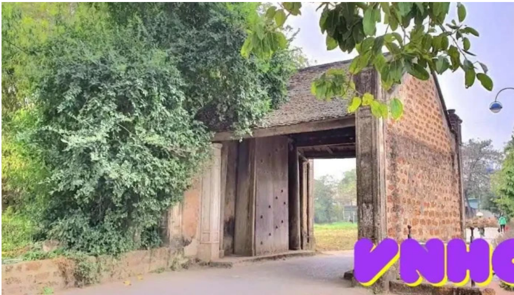
Lang co duong lam tat ca