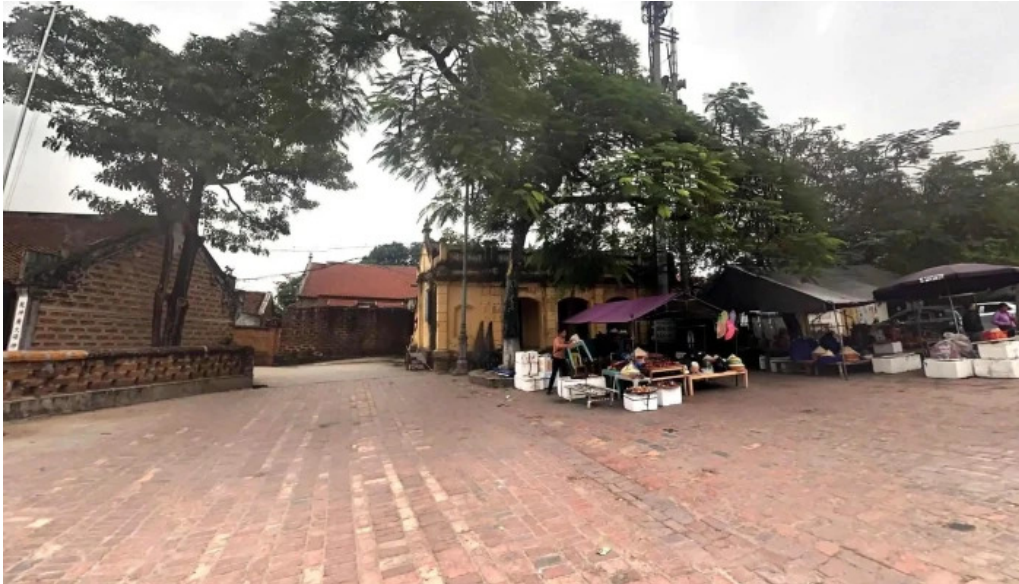
Lang co duong lam che do xem pho va 360deg