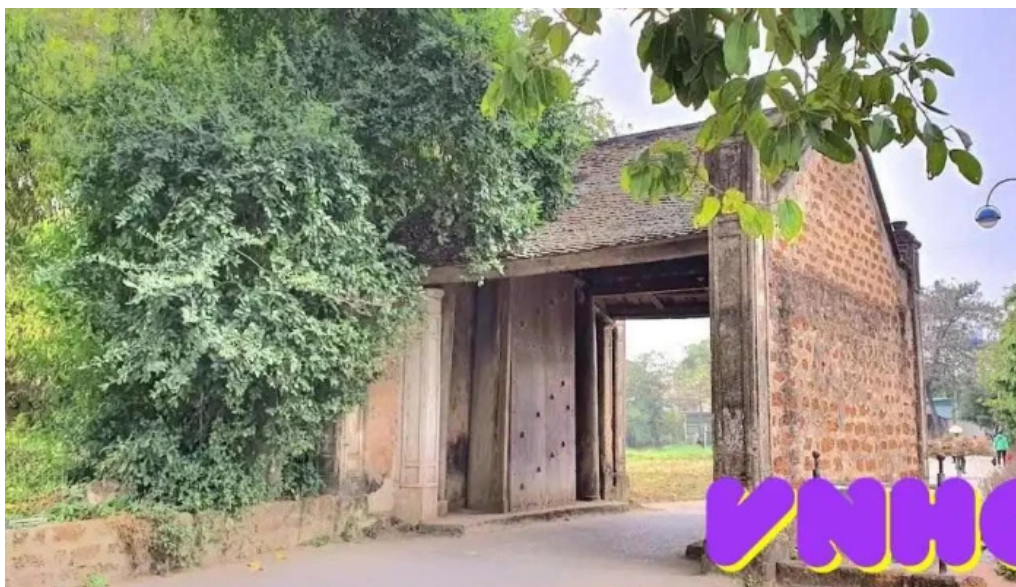
Làng c? ???ng lam ha n?i