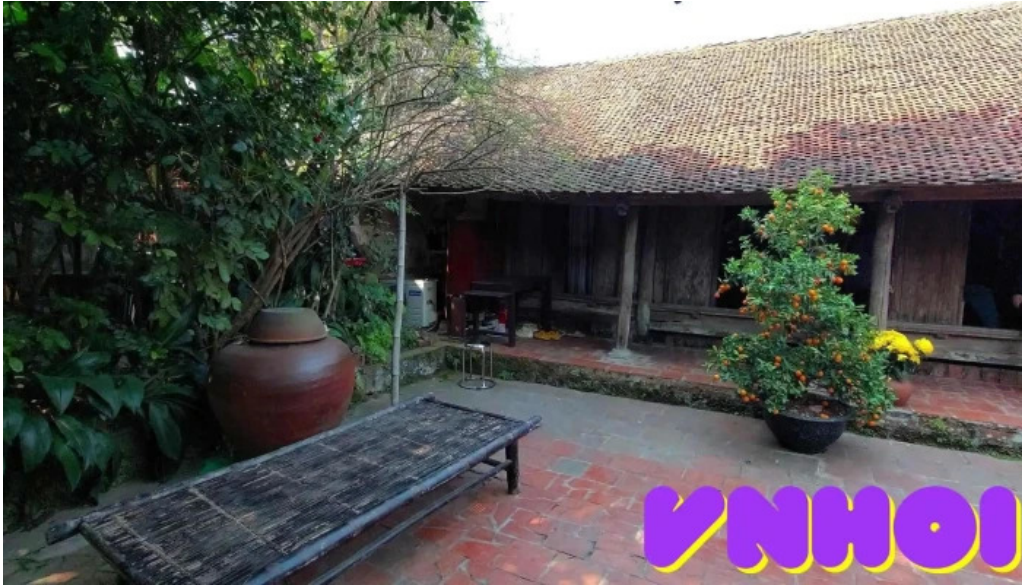
Lang co duong lam video