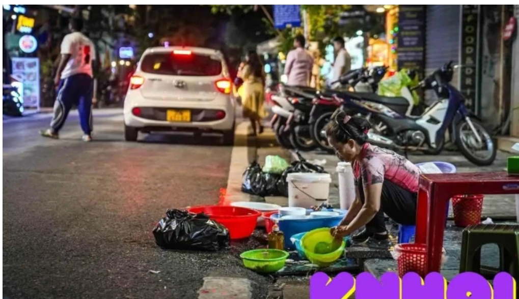
Khu pho co ha noi moi nhat