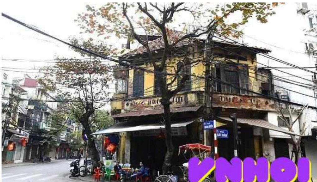
Khu pho co ha noi tat ca