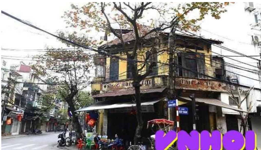
Khu ph? c? ha n?i ha n?i