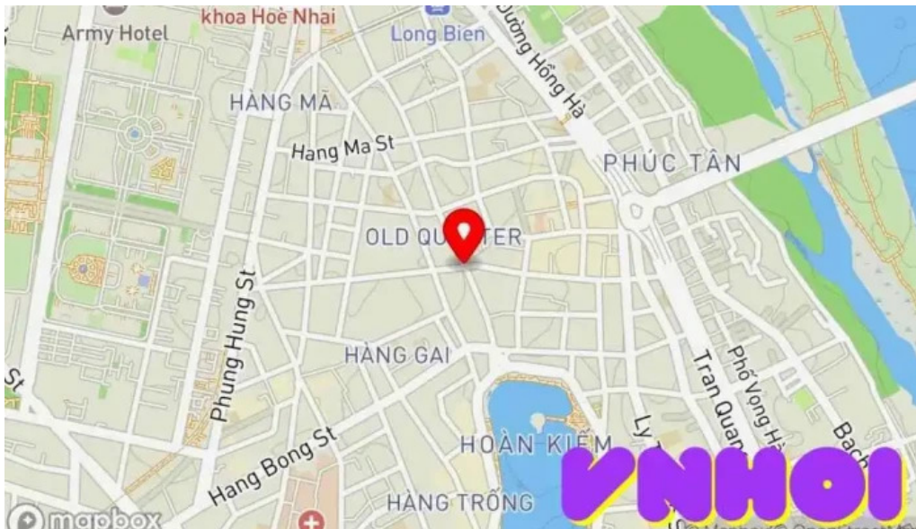
Khu phố cổ Hà Nội bên ??