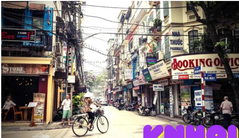
Khu phố cổ Hà Nội của chủ sở hữu