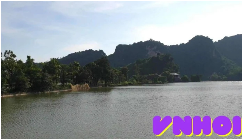
Khu du lich quan son video