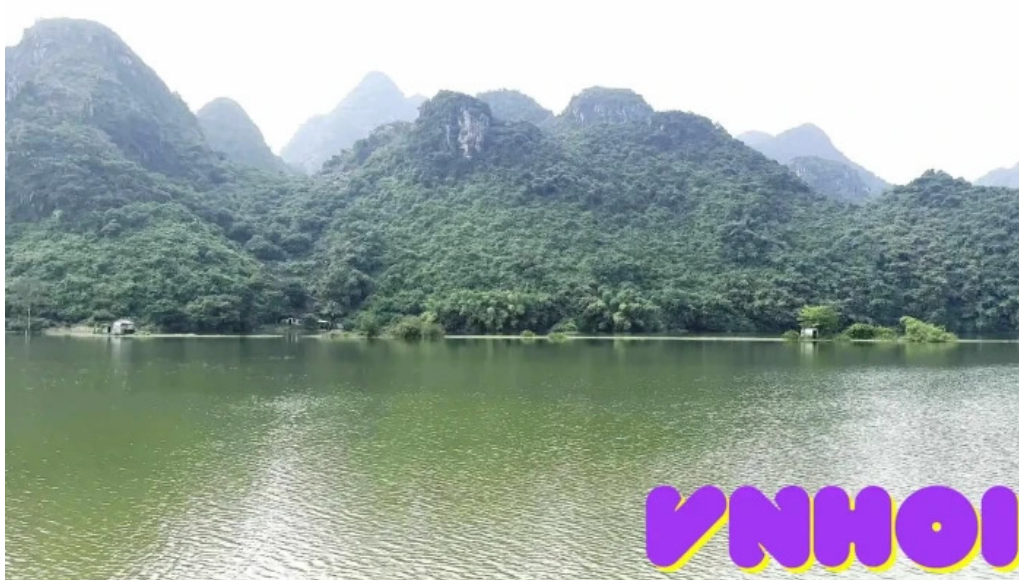
Khu du lịch quan sơn núi