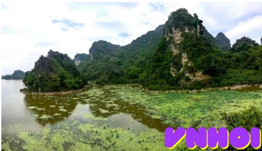
Khu du lịch quan sơn hà nội