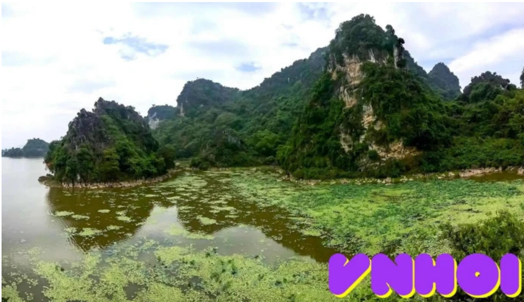
Khu du lich quan son tat ca