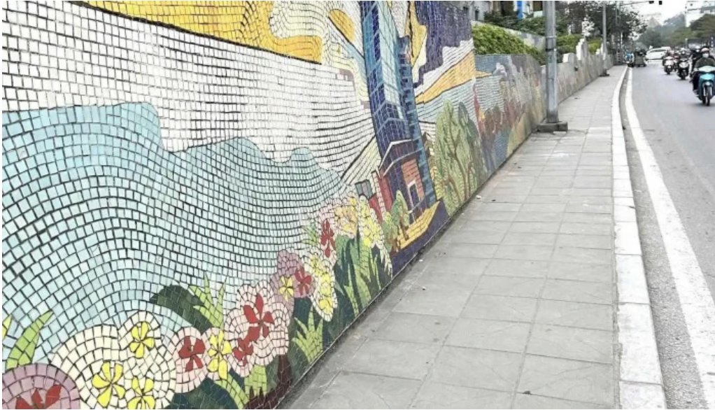
Con duong gom su tat ca