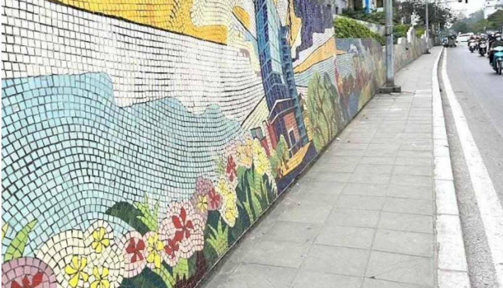
Con đường gốm sứ Hà Nội