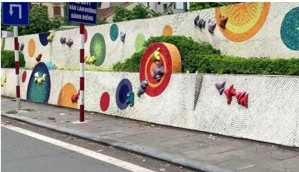
Con đường gốm sứ video