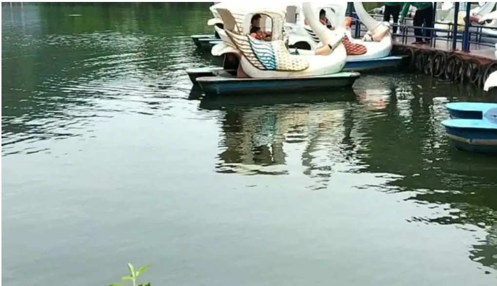
Ao vua video