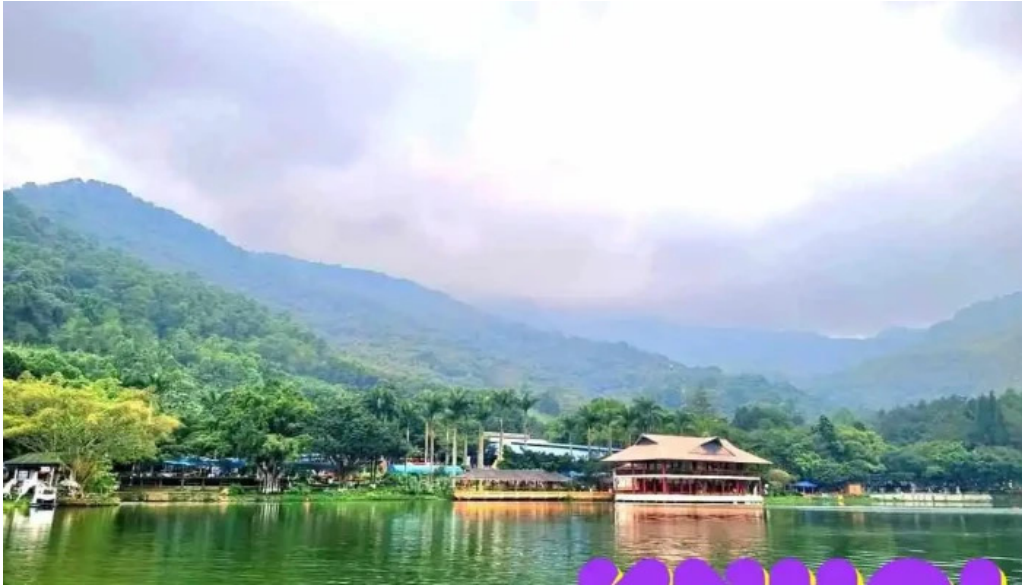
Ao vua tat ca