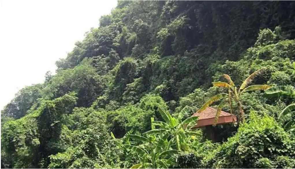
Nui cam ngu dong tat ca