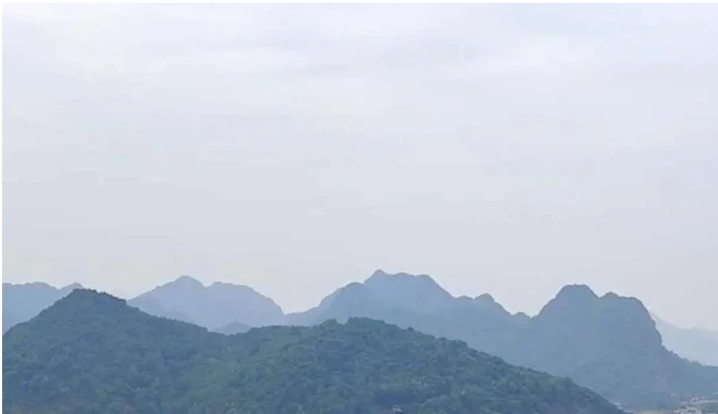
Nui cam ngu dong nui