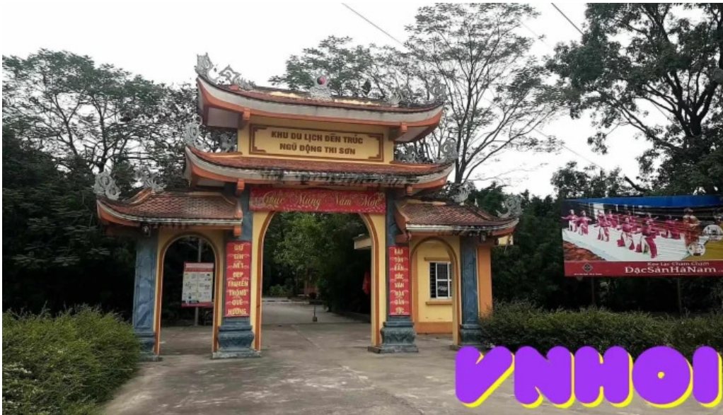
Núi cam ngu dong video