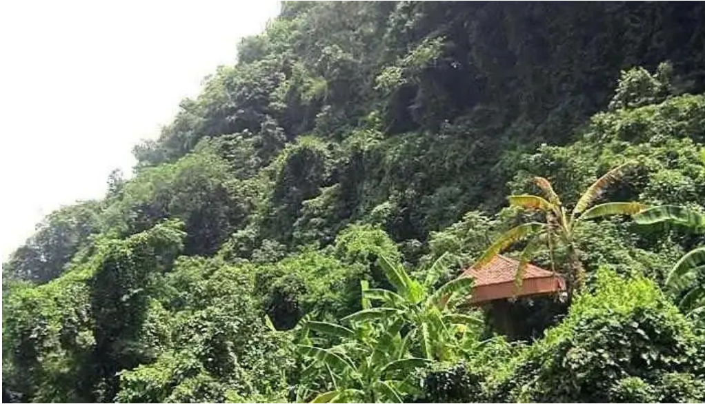
Núi c?m ng? ??ng ha nam