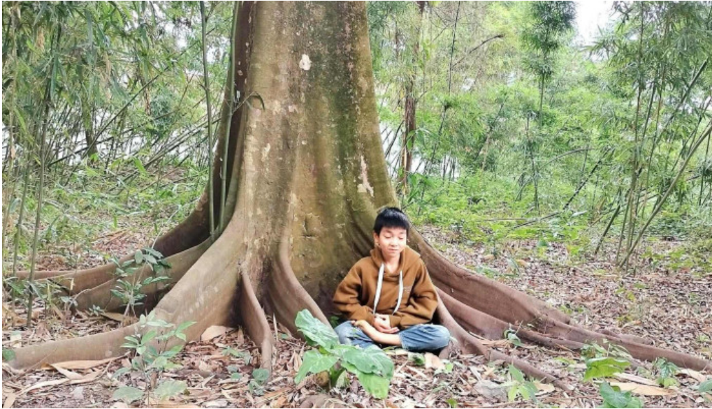
Núi cam ngu dong moi nhat