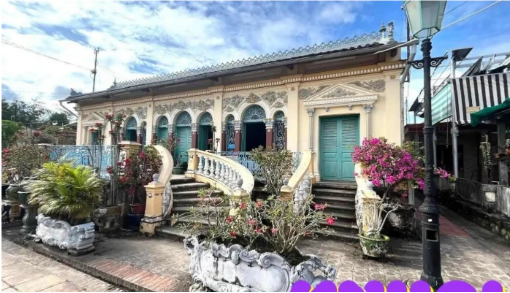
Nha c? bình th?y c?n th?