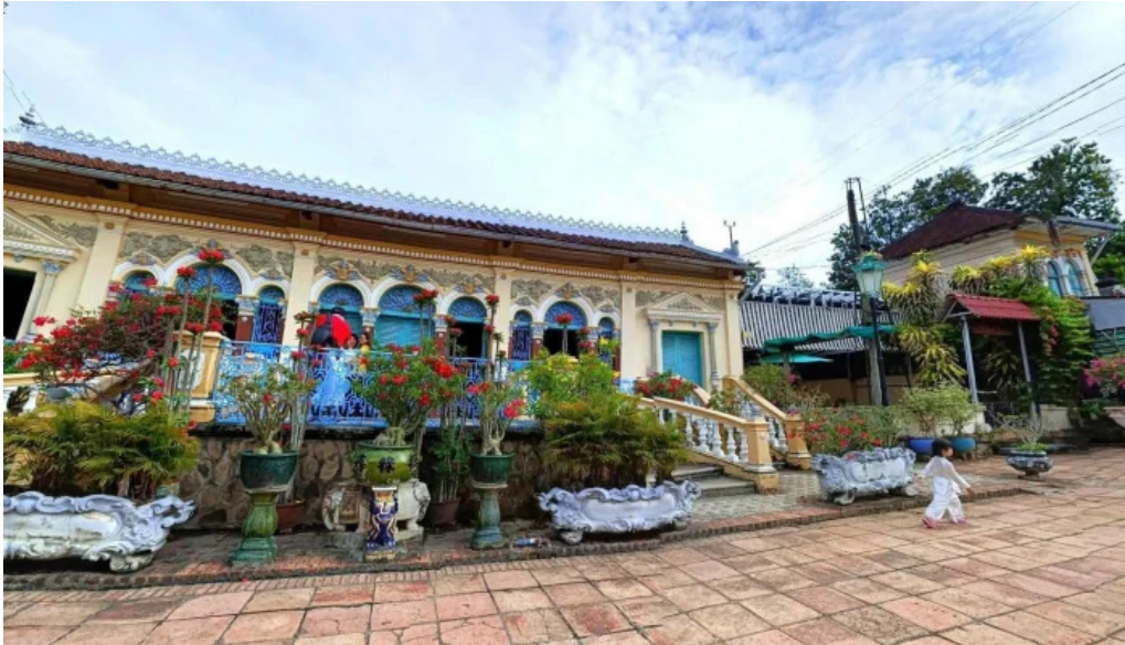
Nha co binh thuy che do xem pho va 360deg