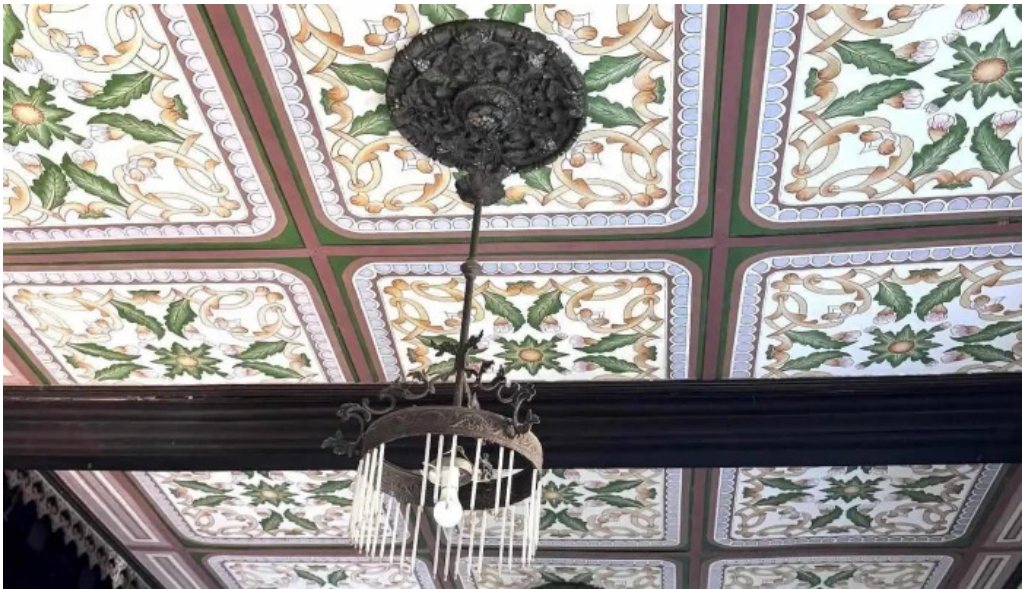
Nha co binh thuy moi nhat