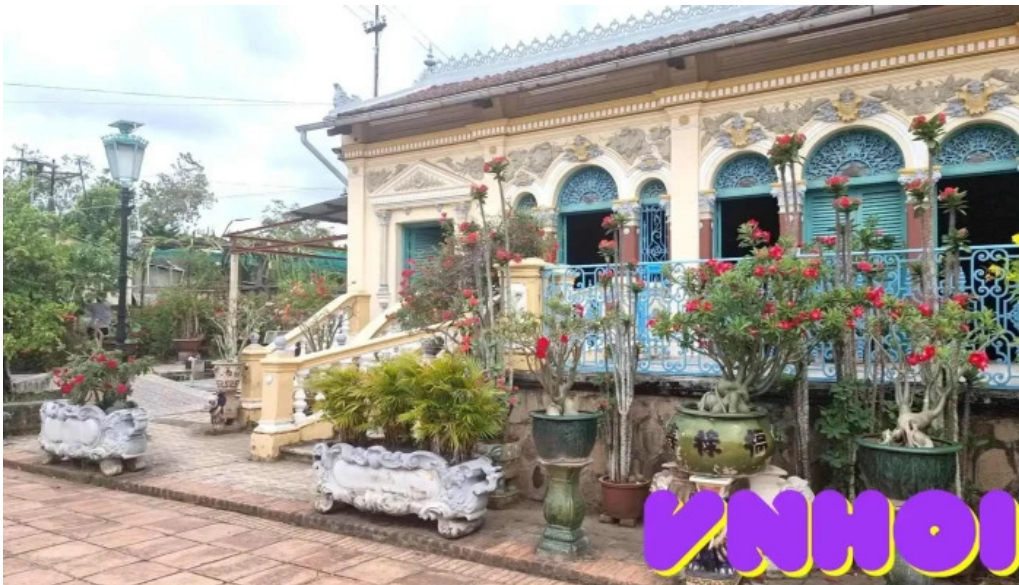
Nha co binh thuy video