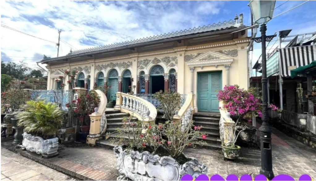
Nha co binh thuy tat ca