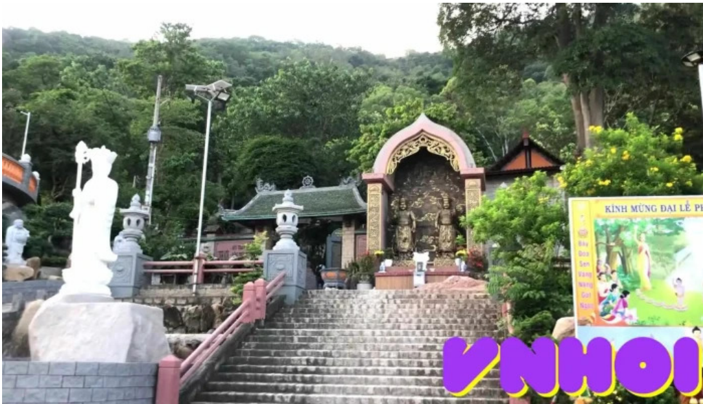
Dinh nui thi vai video