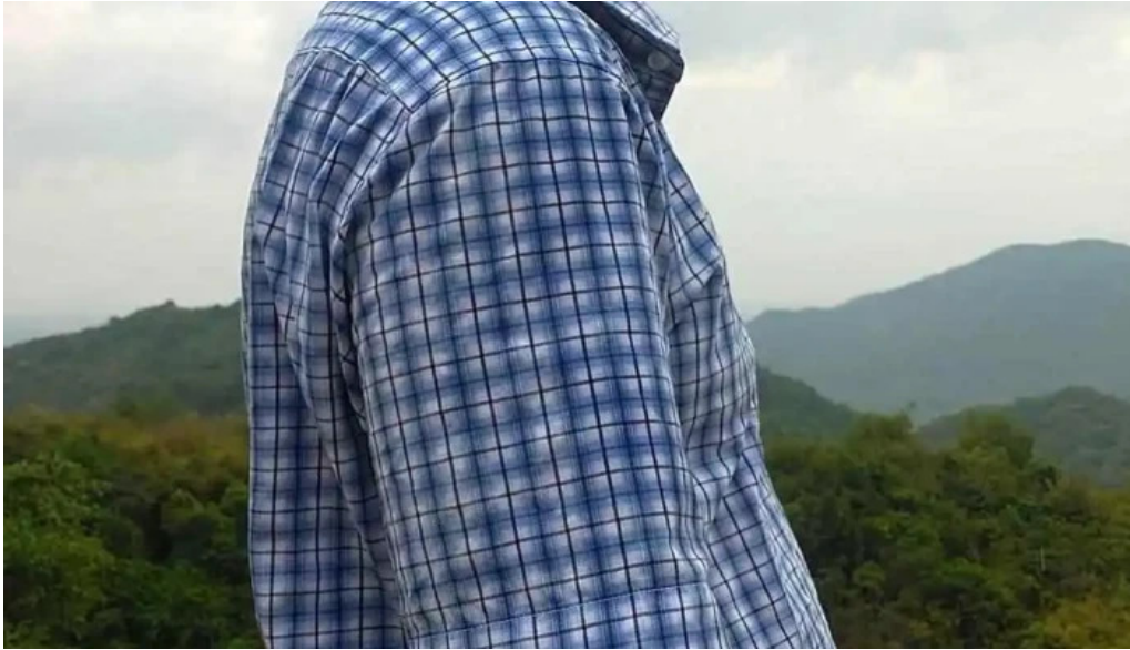
Dinh núi thi vai moi nhat