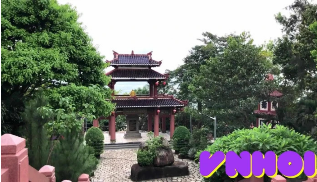
??nh nui th? v?i ba r?a v?ng tau