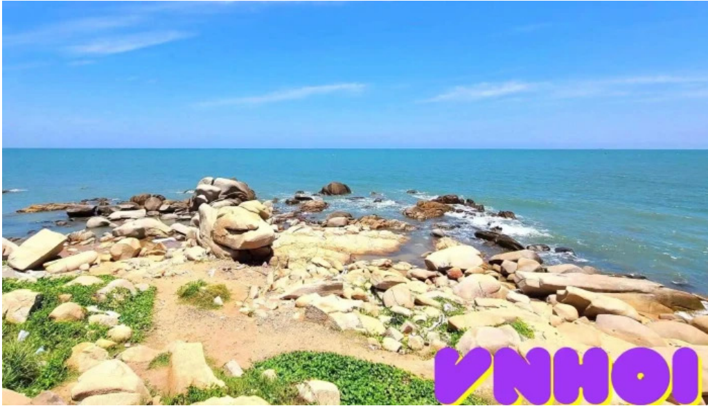
Đeo nước ngọt bãi biển Vũng Tàu