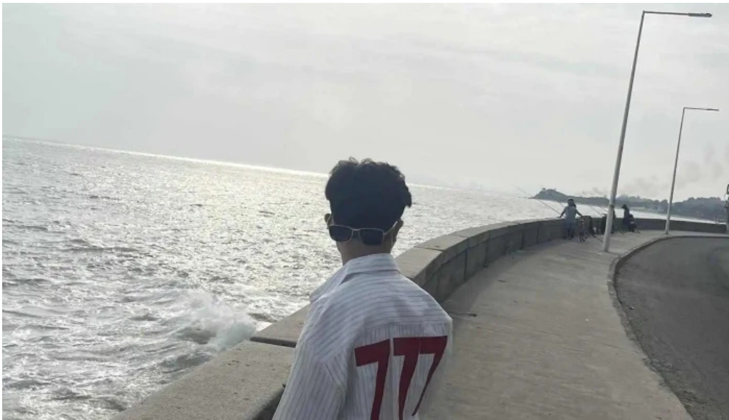
Deo nuoc ngot moi nhat