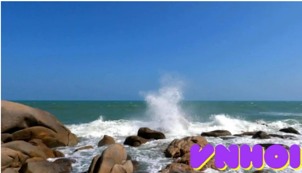
Đeo nước ngọt video