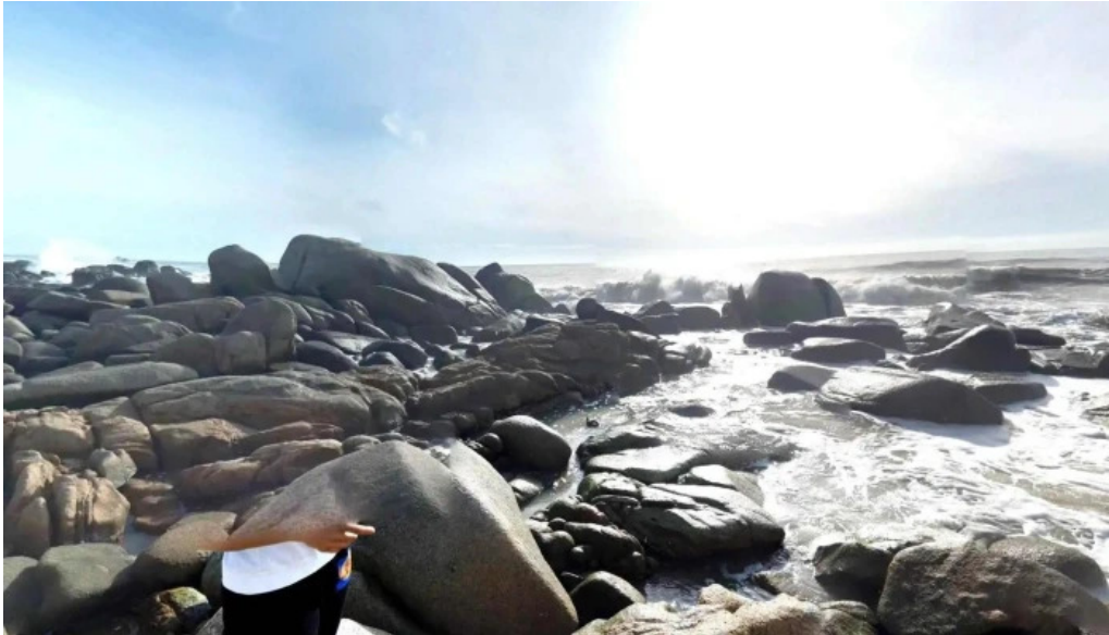
Đèo nước ngọt che do xem pho va 360deg