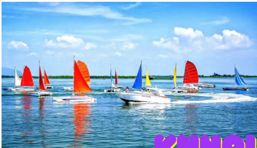
V?ng tau marina museum ba r?a v?ng tau