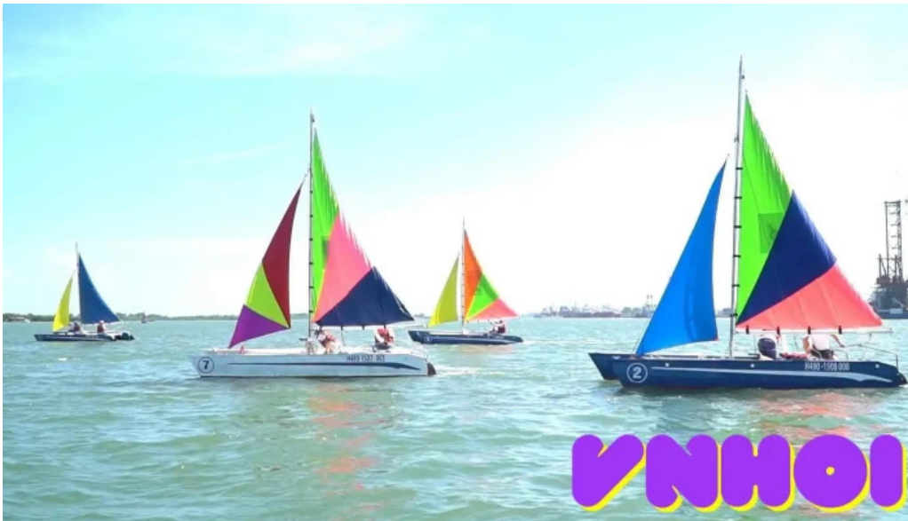
Vung tau marina museum cua chu so huu