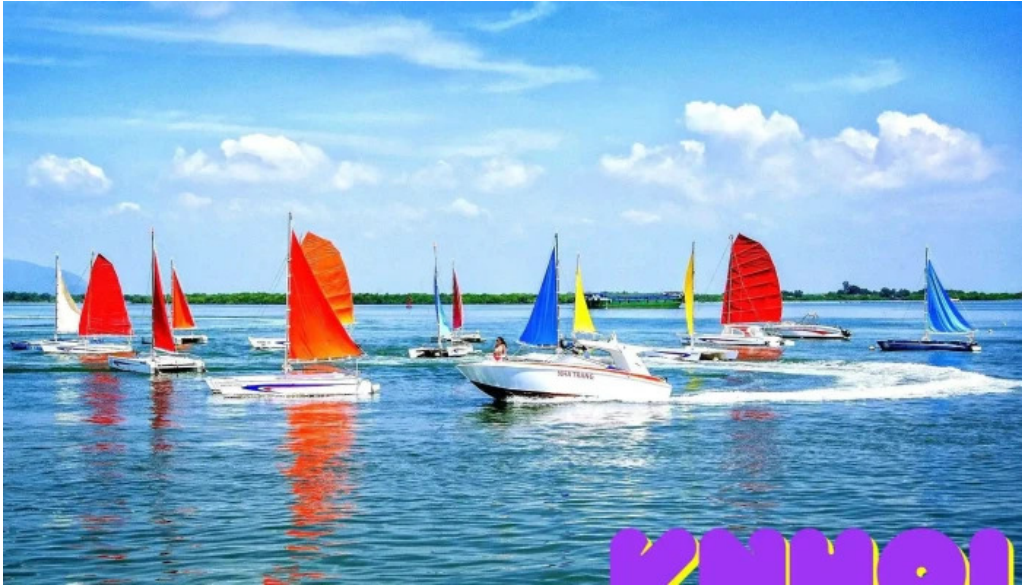
Vung tau marina museum tat ca