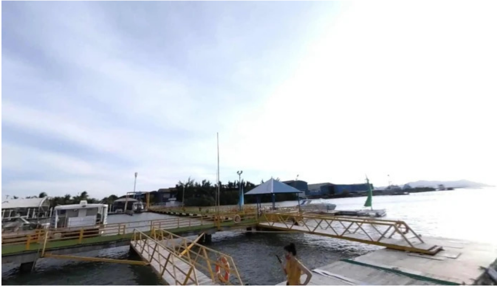
Vung tau marina museum che do xem pho va 360deg