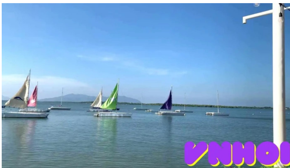
Vung tau marina museum video