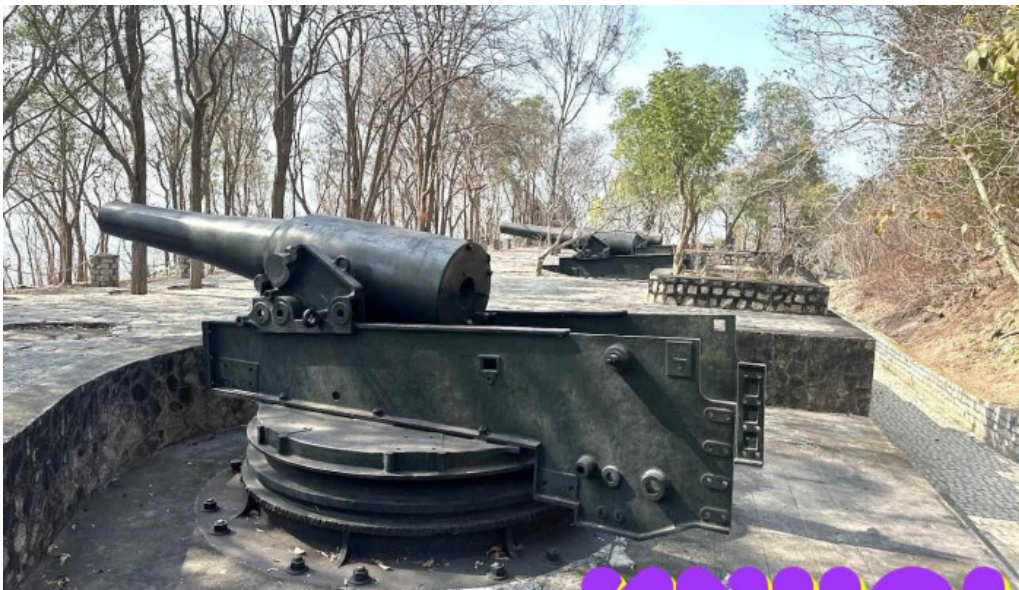
Pháo ?ai núi l?n ba r?a v?ng tau