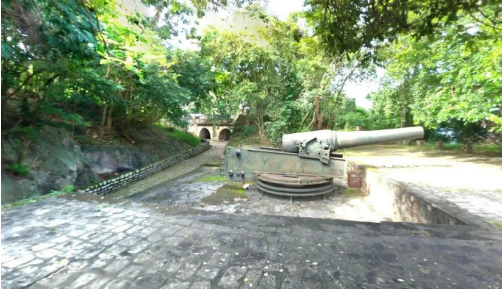
Pháo đại núi lớn chế độ xem pho và 360deg