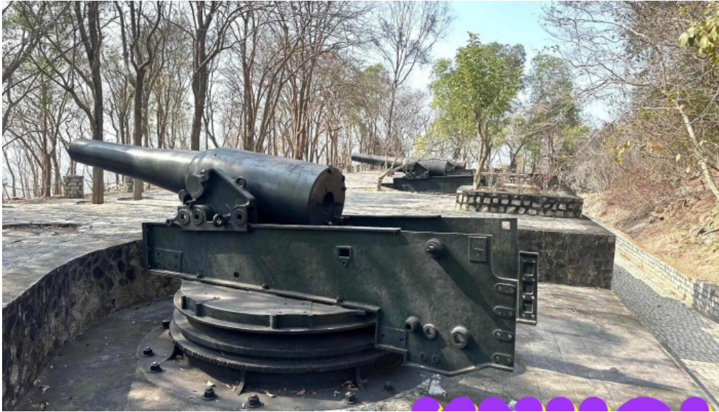
Phao dai nui lon tat ca