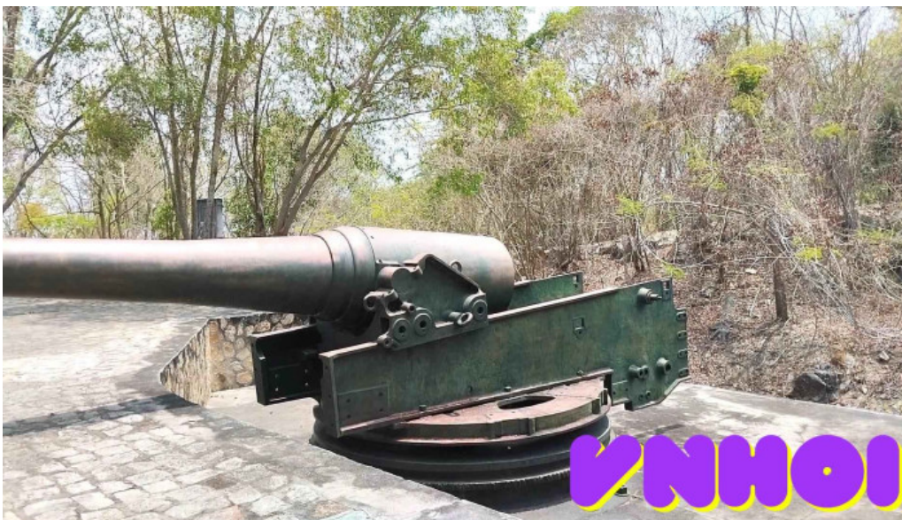
Pháo dai núi lon video