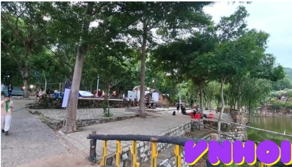
Khu du lịch sinh thái ngọc xương video