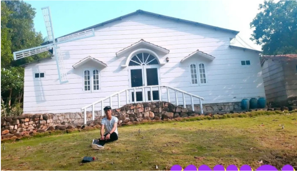
Khu du lịch sinh thái ngọc xương tát ca