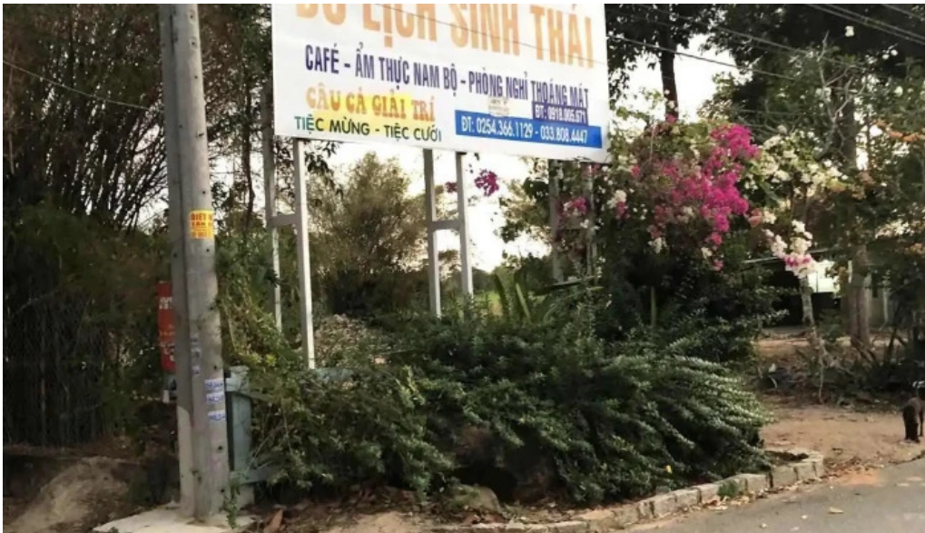
Khu du lịch sinh thái ngọc xương mọi nhat