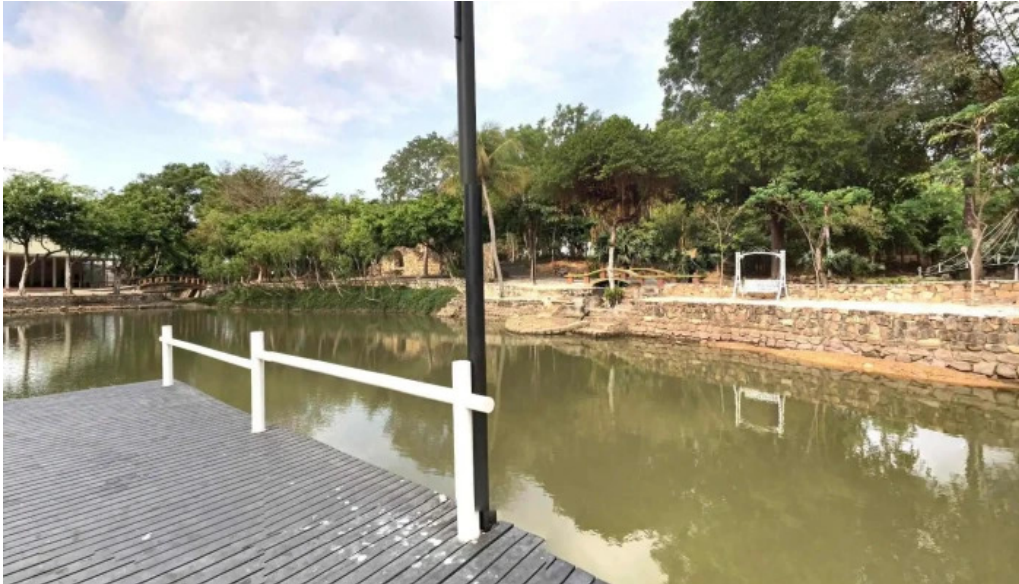
Khu du lịch sinh thái ngọc xương che do xem pho va 360deg