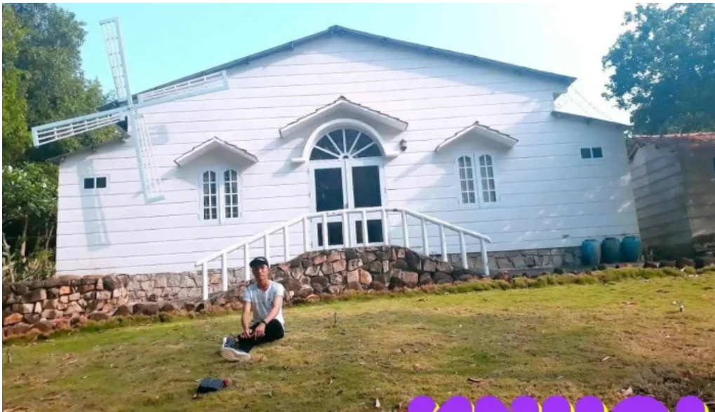
Khu du lịch sinh thái nông trường ba r?a v?ng tau