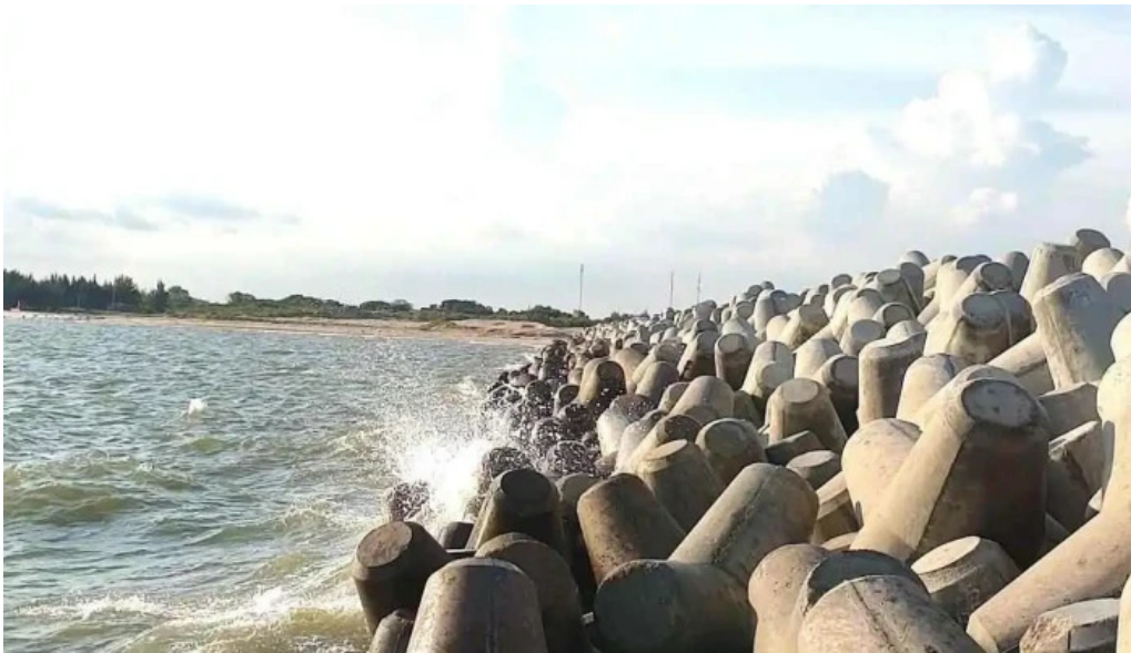
Ke chan cua bien song ray video