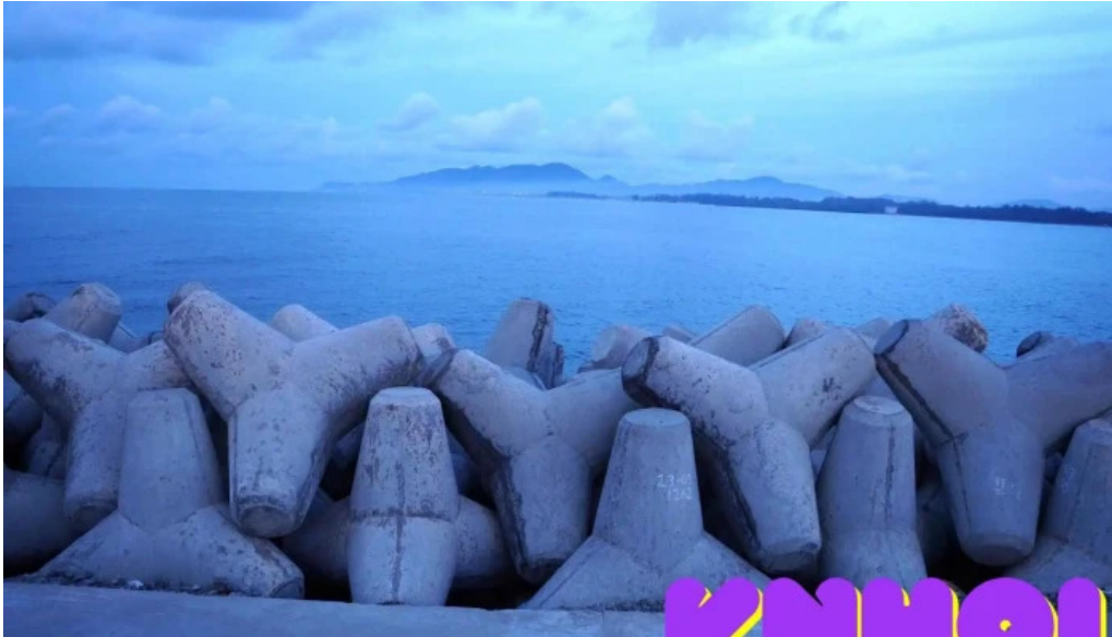
Ke chắn của biển sông ray tat ca