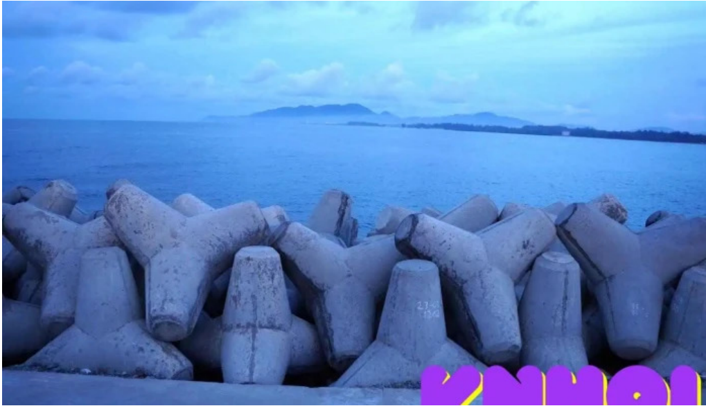
Ke ch?n c?a bi?n song ray ba r?a v?ng tau