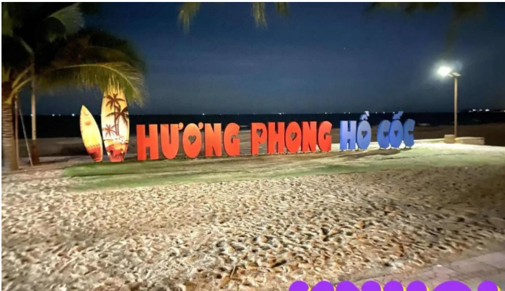
Huong phong ho coc moi nhat