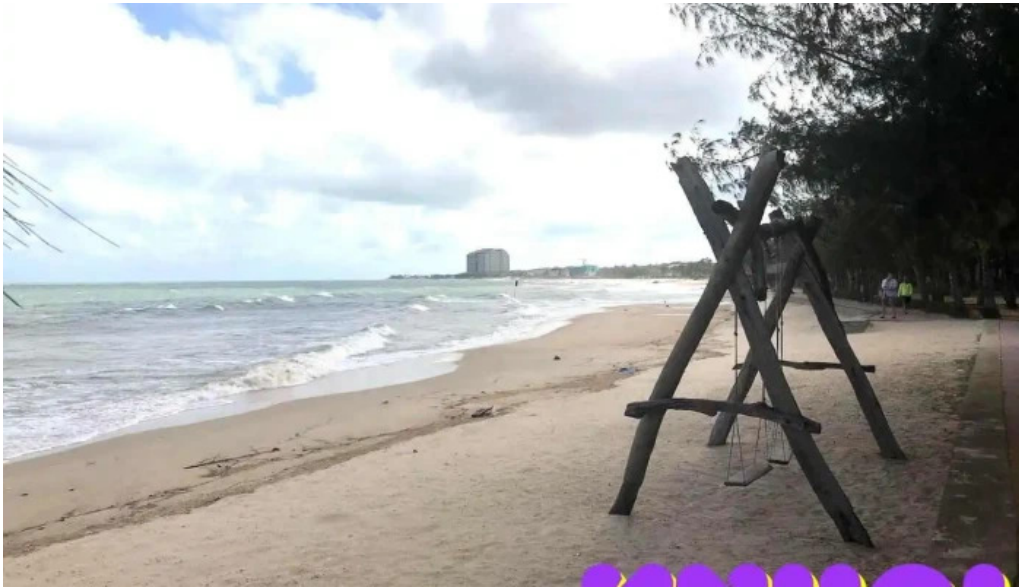
H??ng phong h? c?c ba r?a v?ng tau