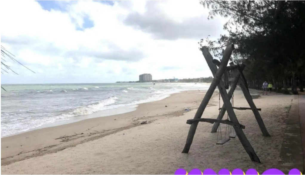
Huong phong ho coc tat ca