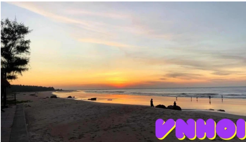
Huong phong ho coc video